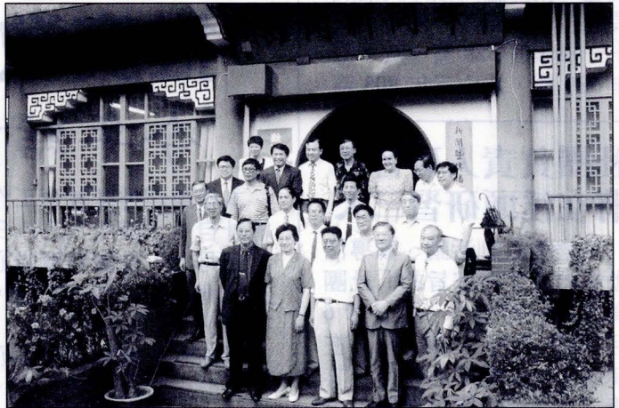
照片說明：大陸新聞學者訪本校新傳學院