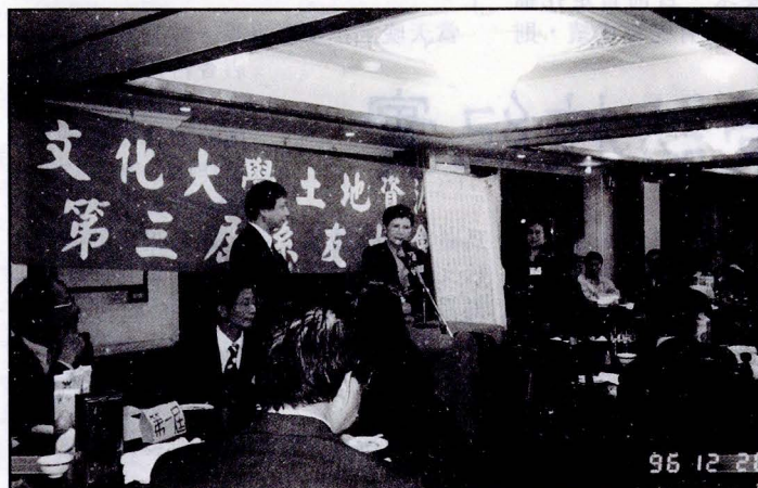
土地資源系系友大會，校長致詞。

整個大會氣氛集溫馨、感性、輕鬆於一堂，不分年齡性別都非常珍惜交談機會，知無不言，言無不盡。大會最後舉行由歷屆學長姊提供紀念品的抽獎活動，並在一連串的歡呼聲結束了難忘的聚宴。