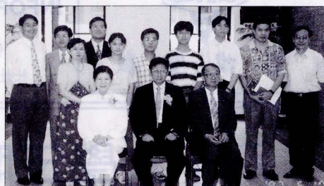
華岡風情攝影比賽，張董事長、林校長、教學總三長等師長與得獎同學合影留念。