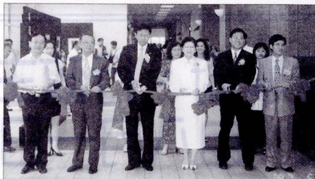
華岡風情攝影比賽暨典藏相片展開幕剪綵。

引許多駐足欣賞人潮。畢業典禮當日更成為師生與家長爭相攝影留念的熱門場景，為此次攝影展留下成功的扉頁。(本文由公關室提供)