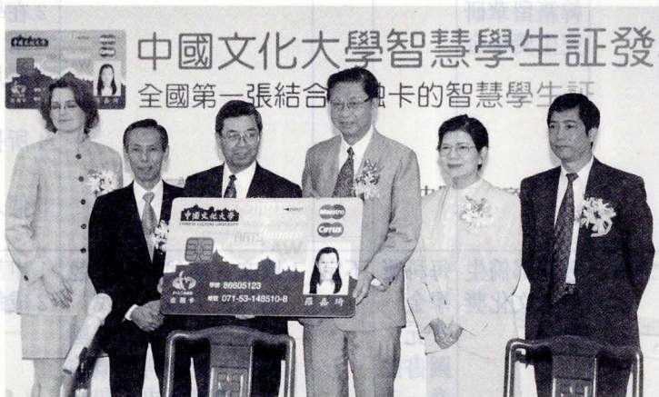
中國文化大學與中國信託商業銀行在 9 月 25 日簽約發行 IC 智慧學生證