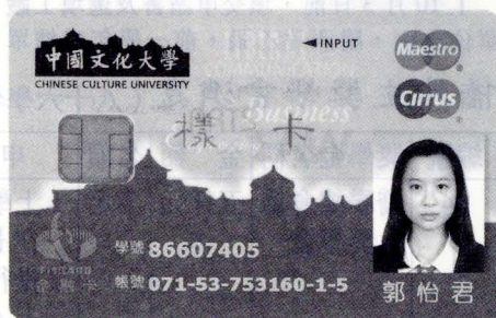
中國文化大學發行全國第一張 IC 智慧學生證，將發給 86 年學年度入學新生(含轉學生)，二、三、四年級將階段性換發。

運用金融卡 IC 晶片的功能，學校行政管理工作將可全面資訊化，不僅提升工作效率，同時大幅降低作業成本，學生持卡人則提早使用現代化金融工具，享受無現金交易的便利，最重要的是金融卡無信用卡透支功能，可培養學生量入為出的消費習慣，建立正確的理財觀念。