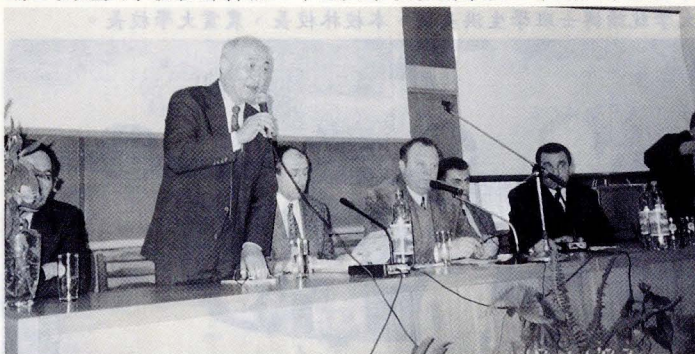
吳部長拜訪烏克蘭農業大學。

部長非常重視我國大學與外國大學之國際學術交流，於本年11月16日至25日在駐德文化參事林明義組長悉心安排下，不辭辛勞率領國內七所大學校長、教授，訪問烏克蘭與德國著名大學，推展國際學術交流。此次和部長同行前往的國內大學校長訪問團成員有：交通大學校長鄧啓福、中山大學校長劉維琪、中興大學校長李