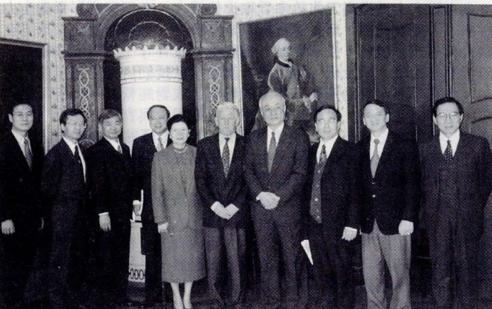
拜訪海德堡大學校長(中)。

本校與海德堡大學簽約姐妹校是今年 4 月，隨即展開學術交流，德文系 20 名同學於 8 月中旬至海德堡大學念書，雖然才 4 個月，德語能力卻有顯著進步，值得欣慰；而明年 3 月 28 日至 4 月 10 日，海德堡大學著名的師生合唱團及交響樂團，將由國際合作中心主任 Eckel 率領來我國演奏，並與本校西樂組師生共同演出，