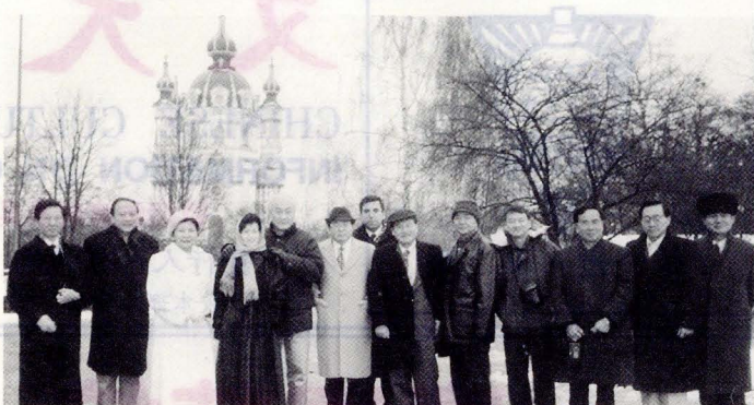
訪問團合影於烏克蘭天主教堂。

感謝本校董事長積極締結姐妹校培育國際人才之卓見，也感謝明所長之教導，她才有機會在烏克蘭攻讀博士學位，她表示希望早日學成歸國，回母校與學弟妹分享學習心得。