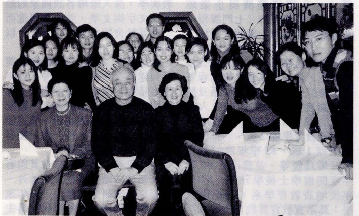
本校德文系交換生與吳部長、部長夫人、校長合影留念。

此次七所大學校長陪同吳部長訪歐 10 天，都感獲益良多，對部長尊重大學自主、重視國際學術交流等之教育理念，及所提的教育發展目標與教改政策，更為敬佩，各大學也將更努力校務發展，積極擴展國際學術交流，邁向國際一流學府。