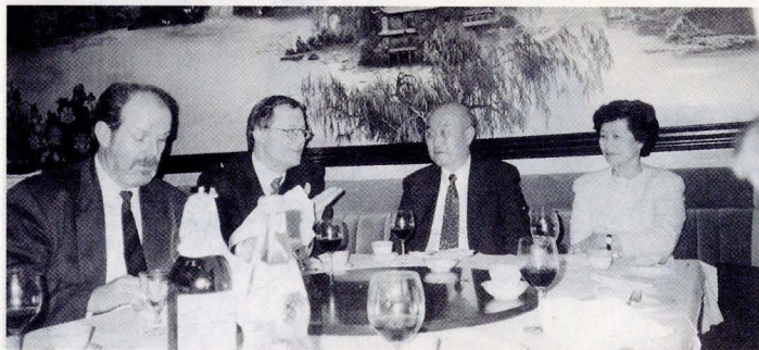
(左至右) 科技大學教授、科技大學校長、吳部長、部長夫人。