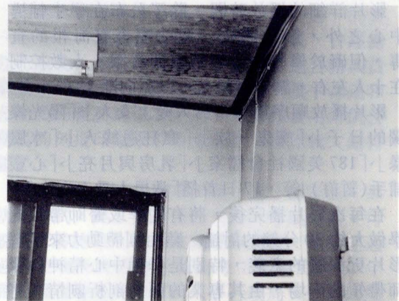
▲熱水器上方天花板煙燻嚴重。