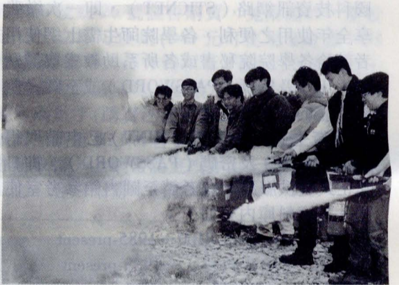
▼同學們親自學習使用滅火器撲滅火源。