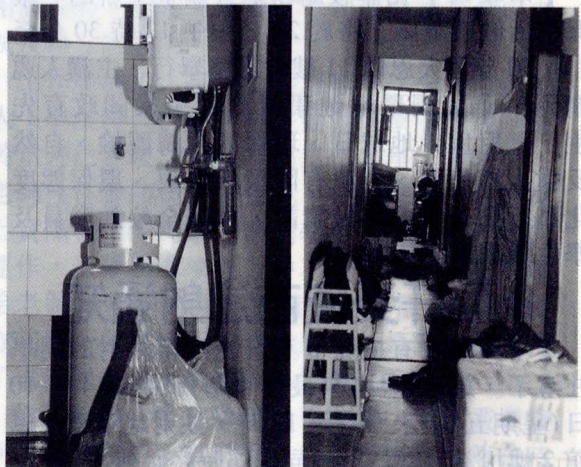
▼瓦斯桶置於室內且周圍放滿易燃物。(左下圖)

【本報訊】為維護學生安全，日前(10日)本校軍訓人員進行本學期第一次集體教官訪視學生校外賃屋住宿安全與交通安全宣導，在住宿安全部份，發現多數住處皆無防火設備，亦有少數住處將瓦斯桶置於室內，相當危險，其中菁山路34巷22號3樓居住安全有顧慮。