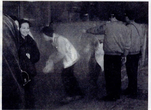
▲同學們頭套裝滿新鮮空氣塑膠袋，迅速通過煙霧體驗室。

在經過謝副中隊長的解說後，在場的師生隨即前往大恩館廣場及大倫館外停車場分別親自體驗消防設備的操作與使用。在煙霧體驗室中，消防隊員們模擬火災現場煙霧迷漫，師長與同學在透過消防人員的示範後，分別以塑膠袋裝新鮮空氣套在頭上，採低姿勢迅速通過煙霧體驗室，感受火災發生時的情況，隨之，由同學輪流學習操控消防水袋，最後，則前往大倫館外的室外停車場讓同學學習滅火器的正確使用方式。