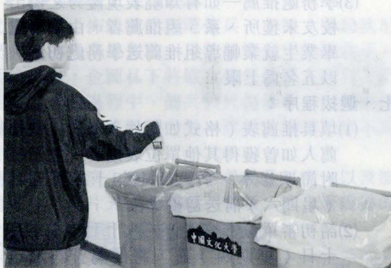
作，卻可確保同學學習環境的品質，相信在全校師生全力配合下，定能落實華岡的環保工作。

【本報訊】轉眼間寒假即將到來，台北的青少年們都有甚麼計劃呢？有些人準備利用假期打工賺些零用錢，有些人想參加輔導課程，或打算好好輕鬆一下，去旅遊的也大有人在，而出國遊學仍是最受青睞的寒假計劃了；因爲除了加強語文，更是人生經歷難得的累積與擴展。文化大學遊學團多年來廣受學生、家長及教育界人士肯定與喜愛，全程由留學歸國之帶團老師照料，在一九九九年寒假再次推出柏克萊大學團、美加雙國住宿家庭行程、英國西歐雙組合、澳洲大自然英文營、紐西蘭英語遊學傳奇。