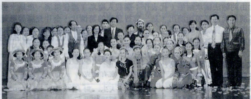
張董事長、林校長蒞臨觀賞，會後與全體演出者合影留念

今年華岡舞蹈團年度公演是以中國傳統的文學、戲劇與民俗舞蹈作為主要的創作題材，每一位編舞家都從自我的知識領域與生活經驗中，創作出具有中國精神的舞蹈作品。