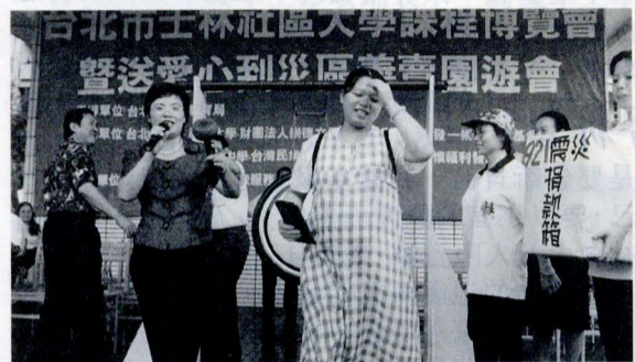
冒著大雨前來捐款敲鑼，身懷六甲的她說是為孩子做善事來的。

這項活動是由士林區社區發展協會，及發一崇德慈善基金會等十個慈善團體共同舉辦，並結合新成立的士林區社區大學，除舉辦社區大