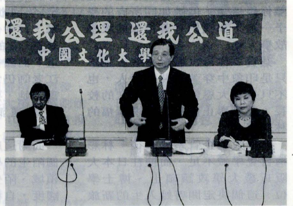
■文大教職員在立委穆閩珠陪同下至教育部陳情

教育部因各部次長皆在處理震災事宜，由高教司次長吳清基接受抗議聲明，針對這次的陳情，吳清基表示，教育部對文大未預設任何立場，願意配合改善，目前教育部已委託相關單位擬定計劃，未來將朝學系評比的方式做評鑑，至於其他師長提出之問題，因時間因素無法一一回答，留待他日再予回應。