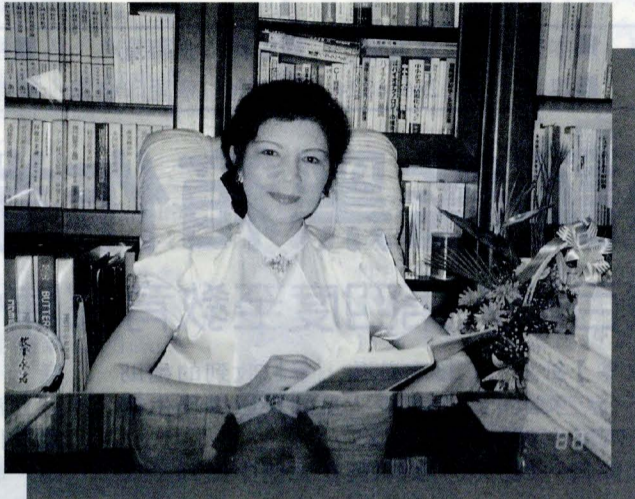
■中國文化大學校長林彩梅

更值得一提的是，獎學金的獲獎者必須參與由扶輪社舉辦的會議、演講，在這些活動當中，林彩梅認識了許多日本產官學界的高級長官，並被他們邀請到家中作客，主人們邀請她參觀名勝古蹟、看相撲比賽……，在此過程中，她得以真實體驗到日本人的生活、日本人的文化，更學習到他國文化中的優點。