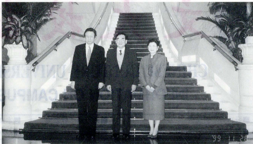
董事長、校長與大陸台辦副主席王永海先生合影

為了慶祝廿週年所慶,遙感所張燈結綵動員了全所的員工。除了展示近年來的遙感研究與應用成果之外,更以主題說明方式,開放不同之研究室,詳細為訪客門說明研究之細節。中科院遙感所現有職工二百四十五人之多,結合了遙感(Remote Sensing),地理資訊系統(GIS),與全球定位系統(GPS)的知識與技術,下設遙感資訊實驗室,應用實驗室與應用工程技術研究中心,是目前全世界唯一將「應用」兩字用在遙感研究學術的單位。這是基於當年中國大陸急需先行引入遙感的技術,以實際的應用為宗旨,及早投入為經濟建設展開服務工作之故。例如在探礦的發現與近幾次大陸的洪澇中,該所都發揮了遙感與即時監控的功能。廿年來遙感所歷經草創、奠基、開展的發展過程,目前以邁入國際化的合作與研究為目標,已成為大陸的尖端科技搖籃之一,也是目前大陸「知識創