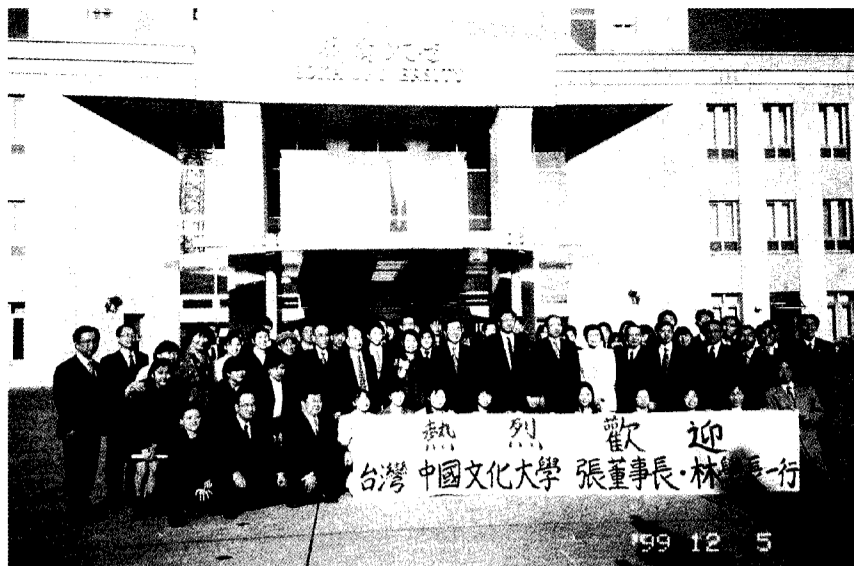
本校訪日團接受創價大學師生熱烈的歡迎