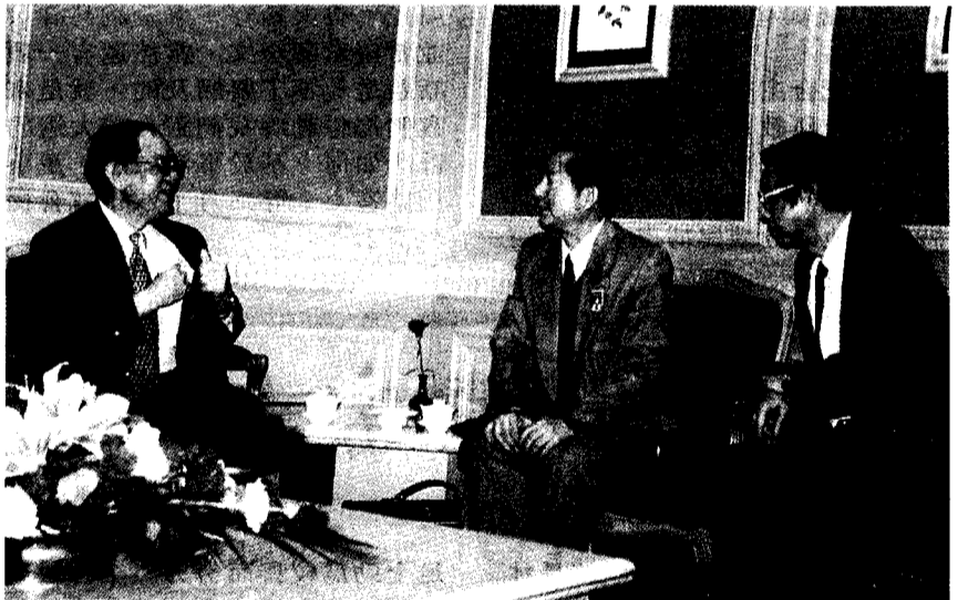
董事長與政協副主席暨工程院院長宋健及廖克先生合影

其中翠宮飯店的建築高聳是一個十足現代化的觀光旅館，在其現代化的牆面上綴有十足中國傳統建築的語彙－綠瓦與門斗。前晚在經過此處時，校長便已「驚豔」。念念不忘之餘，特別交代