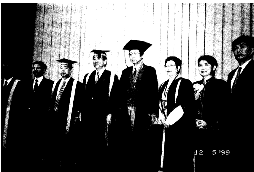
董事長與校長在分獲榮耀後全體合影