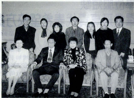
與本校赴姊妹校交換學生合影

二月十一日，張董事長與穆委員參加了「世界和平高峰會議」，張董事長並在會中與論文發表者交換有關太陽能科技應用的意