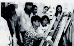
上學期「你好色嗎?」素描班上課情形。

海報訓練B班,活動時間訂於期中考結束89年5月1日至89年5月26日,活動地點在大仁館二樓,參加對象以各社團及各系系學會之美工人才為主,但也歡迎校內有興趣的教職員及同學們報名參加,報名日期3月20日至4月1日報名地點百花池,報名費(教學材料費用)一項700元。