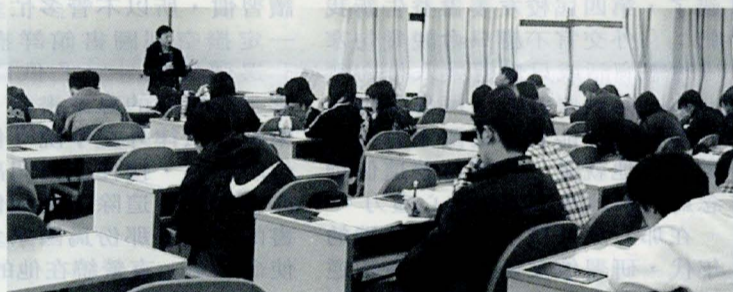
同學們在語文中心的最新設備中上課情形