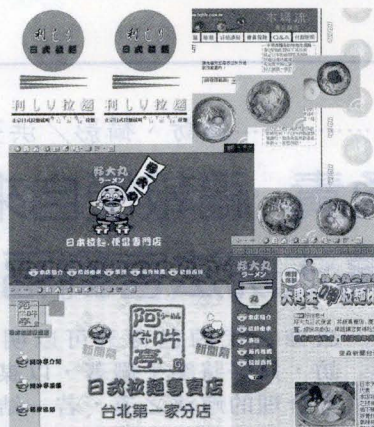
圖 / 網路合成

第一步就要帶大家到 http://www.comsys.com.tw/food/ 的『利拉麵一日式拉麵』，這是一家用十吋大碗公來吃拉麵的店，在這裡能讓你認識拉麵的種種，包括拉麵要如何才較好吃？味噌拉麵是什麼味道？麻辣拉麵和正油拉麵有何不同？甚至還有好康的折價券送給你！