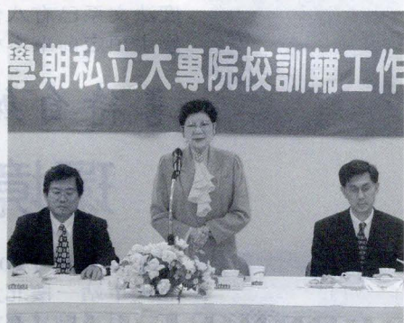
學期私立大專院校訓輔工作

5月22日上午教育部蒞校進行「八十八學年度第二學期私立大專院校訓輔工作經費訪視」，訪視人員包含台大、清大、輔大、高雄科大和教育部多位委員。除由學務處工作簡報外，另有校園參觀、師生及綜合座談。校長亦親臨會場指導。委員們對本校許多特色深感認同，亦提出寶貴的建言，將是我們力求改進的目標。