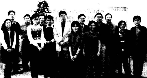
▼資訊中心全體同仁合影

資訊中心認為，獲得認證公司正式評鑑，被評列為ISO9001推薦單位，雖代表對中心實施，品質管理保證制度的肯定，但不會因此而自滿，而將持續維護品質保證成果，以作努力標竿。