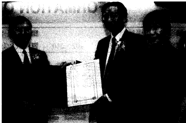
本校頒贈最高榮譽獎給東京富士美術館主席參事池田博正。

四十年以來訪問了五十個國家，成員遍佈一六五個國家，然而，池田大作本人對於尚未前來距離咫尺之國的台灣，感到遺憾；經由中國文化大學與國際創價學會數度建立的友誼關係，以及彼此以心靈來交流的過程。相信不久的將來，池田大作一定會親自前來。因此，十月二日不但是創價學會重要的紀念日，更是中日兩國互許榮譽的日子，期待這一天能為兩國友好的關係開啓新的里程碑。