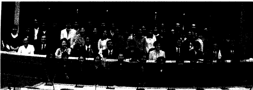
交換學生座談會，讓學校透過座談會更了解交換生的需求。

【記者蘇筱韻報導】本校為促進國際學術交流並提昇同學第二外語能力，多年來致力於締結國際著名大學為姊妹校，並積極辦理交換學生等事宜，因此，交換學生在外國的生活情形，以及在文大留學的外籍交換生適應情況，校方皆相當重視，特訂於十月十八日假曉峰紀念館國際會議廳舉辦八十九學年度第一學期交換學生座談會，讓學校透過座談會更了解交換生的需求。