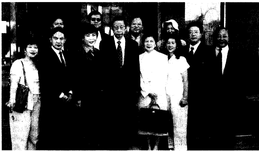
洛杉磯校友與母校師長合影。

交單位，默默地做了許多外交工作。張董事長致詞表示，創辦人的一生大致可分為五個階段：