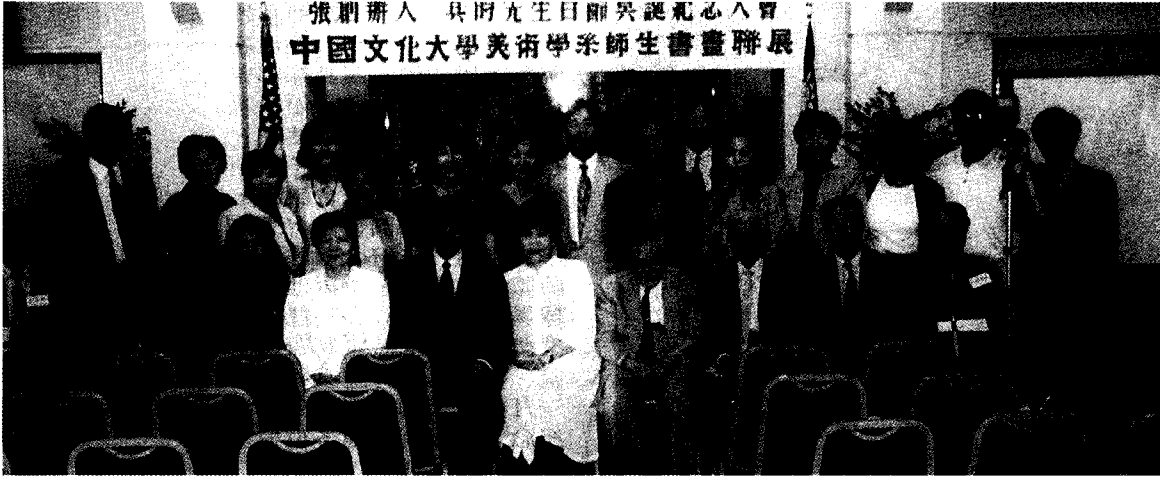
舊金山校友與母校張董事長、林校長、穆董事等師長合影。

張董事長補充說，陽明山中山樓有十幅畫，是九位畫家的，大家都很奇怪為什麼不是十位畫家，原因是歐老師畫了其中兩幅，足見他的作品深受肯定。還有，張大千或其他名畫家的畫都出現仿冒品，但是歐老師的畫很難模仿，為什麼？我們異口同聲發問，因為歐老師是名畫家、書法家，也是詩詞家，畫中的題詩都是他自己作的，他的題字別樹一格，很難摹擬，原來如此。