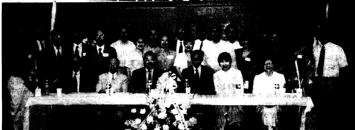
休士頓校友與母校張董事長、林校長、穆董事等師長合影。