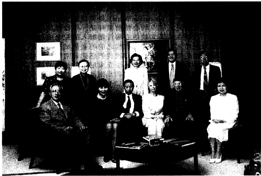
拜會姐妹校印地安那普利斯大學校長、夫人。