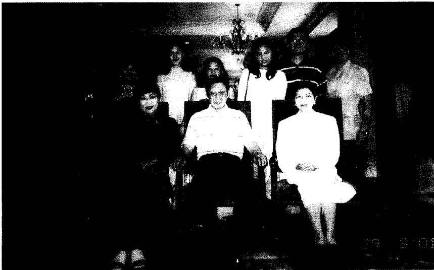
張董事長、林校長與本校在聖道的交換生合影。

聖道大學 (University of Incarnate Word) 是與我們交流最頻繁的姊妹校，這次我們是以會見老朋友的心情前來拜訪。學校位於休士頓附近的聖安東尼市。我們在華僑文教中心舉行創辦人的紀念追思會後，便開車前往聖安東尼市。那裡的天氣比起之前的幾個城市稍微熱了些，但是能在那樣美麗的市區中行進，卻讓我們感到非常輕鬆。據說德州曾是墨西哥的殖民地達兩百年之久，聖安東尼市是德州的第二大城，全城有 30% 的墨西哥人。近二十年來因為經濟成長快速，聖安東尼市在全美大城的排名中，已經由原來的二十多名上升到第八。值得一提的是，這邊的物價並沒有因為經濟的成長而提高，因此聖道大學的學生們得以享受合理的消費以及高品質的生活。讚嘆著這個城市的便利以及賞心悅目，夕陽餘暉下我們抵達在聖安東尼市下榻的旅館，在這邊度過赴美之後的第一個周日夜晚。