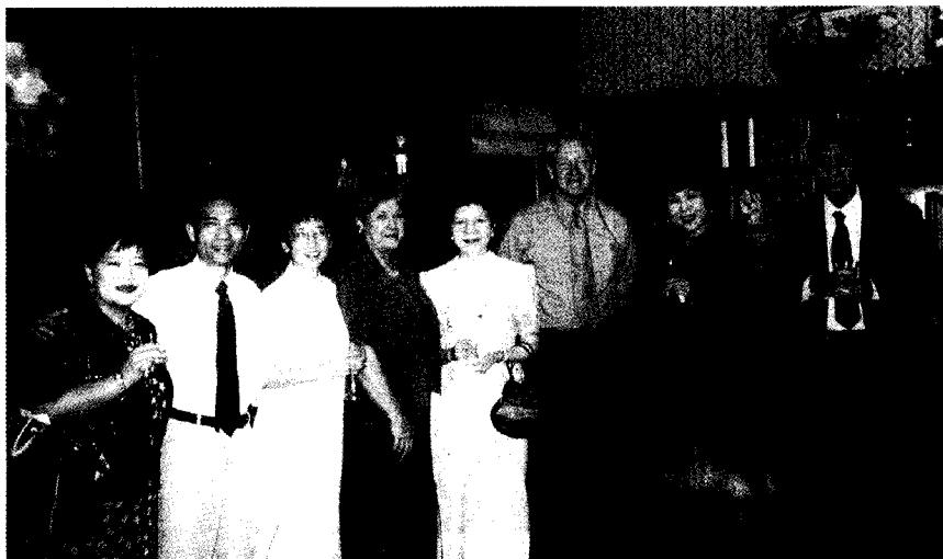
拜訪北科羅拉多大學校長溫馨的家。

接連幾天拜訪了三所姊妹校，領受到美國友人的熱情招待，也在這樣的行程間奠定了往後在交換學生方面的更深的關係。此次美國之