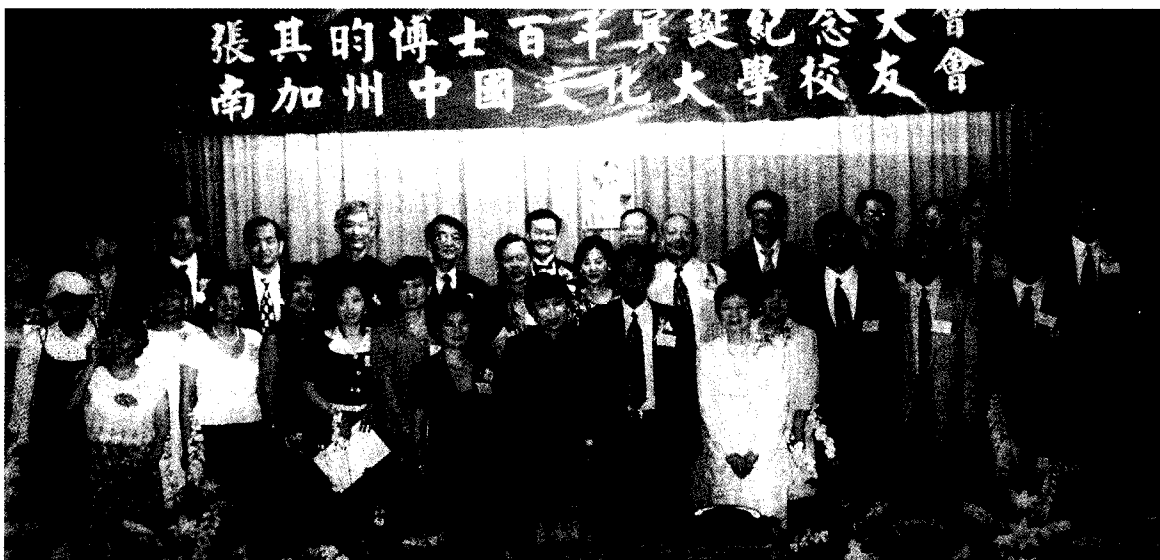
洛杉磯校友與母校張董事長、林校長、穆董事等師長合影。

我們的姊妹校創價大學所屬的東京富士美術館，前年曾和本校合作，在國父紀念館，舉辦「日本名畫文物展」，今年十月又將辦理「西洋名畫展」，屆時歡迎各位有空前往國父紀念館欣賞名畫。本校董事長辦學理念與績效，深獲各國的好評，榮獲創價大學頒授最高榮譽賞；俄羅斯聖彼得堡大學授與名譽博士學