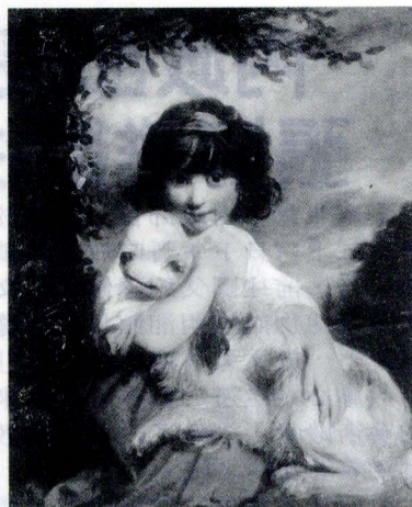
女孩與犬(約 1780) 左叔華·雷諾茲(1723-1792)

理論與技法。學院是培育畫家的唯一場所，就連印象派畫家也都曾接受過學院教育的洗禮。一七六八年成立的英國皇家學院，培育了多位英國畫家。該學院的創設人，也是首任會長左叔華·