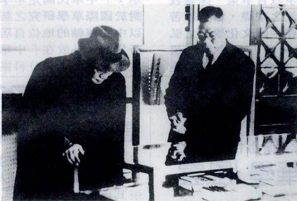
「中國文化大學」名稱由來係先總統蔣公建議，圖為民國 48 年張創辦人陪同先總統蔣公參觀國防研究院圖書館。

除了開學以來相關的大小紀念活動之外，為紀念張創辦人百年誕辰，美術系特於今年秋季舉辦「中國文化大學美術系教授暨校友聯展」，希望藉此次畫展的機會，發揚及承緒創辦人手創中國文化大學之宗旨，