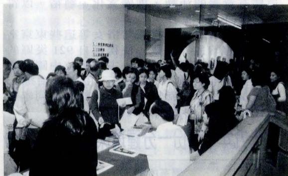
「西洋名畫展」日日觀往不絕，逢週末人潮洶湧；展期即將結束，敬請把握前往觀賞。

【本報訊】為期二個月的「西洋名畫展」已經接近落幕時刻，這場由中國文化大學、國立國父紀念館、東京富士美術館等主辦單位在國父紀念館舉行的畫展，空前地在國內展出從文藝復興時期到二十世紀當代五百年來的西洋美術精華，自從開幕典禮以來，佳評不斷，專家稱譽此一世界級的畫展已經為我國的文化發展奠定國際化的基礎，帶領國人一起走向崇高的美的殿堂。