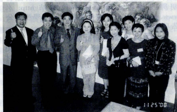
白冰冰參觀西洋名畫展，讚聲連連。由文大總務長唐彥博、公關室主任賴祥蔚等人進行導覽解說。

身為一個公眾人物，能夠在忙碌的生活中抽空參展，增加自己的藝術修養，屬難能可貴的，不同於其他演藝人員，只懂利用媒體作秀，相較之下，不禁讓人感覺白冰冰真的已不像從前的綜藝大姊姊，而是一個懂得為自己及為別人生活的藝人。「西洋名畫展」能在社會如此動盪的局面下，促進我國與日本的文化外交關係，提供國人一個良好的休閒去處，對於心靈的沉澱無疑是最好的藥劑，畢竟藝術是人類文明最大的資產。