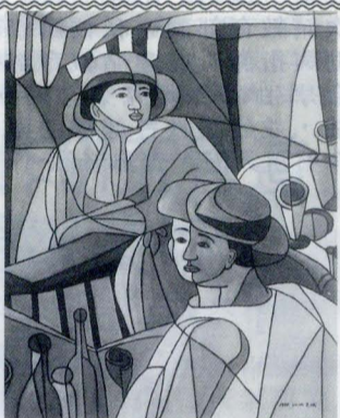
約會 (1999) 翁美娥

這幅畫取材自雷諾瓦 (RENOIR 1841-1919) 所繪的畫作「船上的午餐」(Luncheon of the Boating Party)，人物採用多視角的立體主義，頭度之正面與側面並存，手則翻轉出側面的輪廓，以線條重複描繪形體，營造成未來主義之動態效果，桌子及靜物卻採用反透視之表現方法直立起來。至於色彩方面，整幅畫以綠到黃之色階 (degre' chromatique) 平塗鋪色，再配上三分之一的紅色系色階及小面積的藍色系色階，促使畫面的組合猶如音樂般的旋律，寧靜中有律動；安詳中有閃爍。整幅畫充滿了歡樂的氣氛，觀賞者站在畫前有一種融入畫面參與共享的感覺。