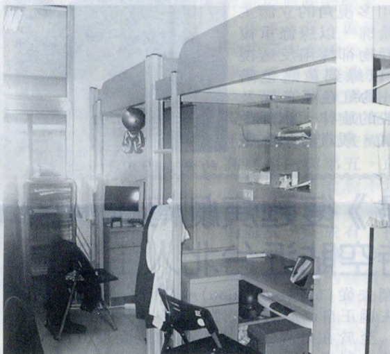
更新學生宿舍床組、書桌。

因此，合作取締違建的民宿，保障外宿生權益，是目前當務之急，而學校為解決宿舍籌建問題亦是不遺餘力，但最重要關鍵則是政府全額補助公立大學興建宿舍，私立大學則需自費興建，而聯合學生宿舍卻遲遲不見推行，顯見教育部有待加強保障私校學生權益。