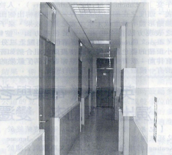
更新學生宿舍室內裝潢(寢室門更換、牆面粉刷)