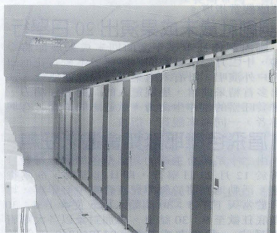
總務處改良學生宿舍衛浴設施。