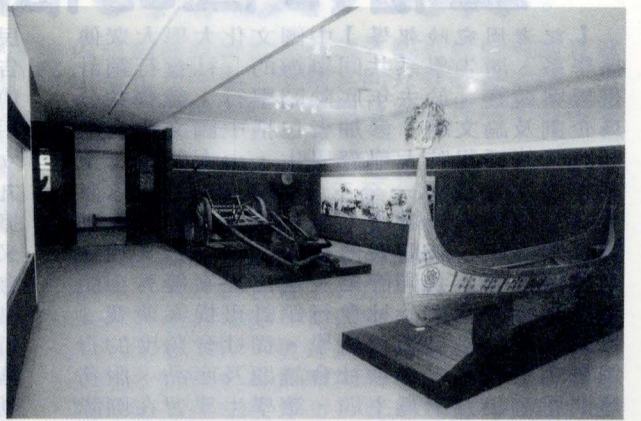
目前在國父紀念館展出的台灣歷史文物展，展出了台灣先民謀求生活的各項農漁器具。

蘭嶼雅美族人和台灣其他的原住民一樣都屬於馬來波里尼亞系，但在文化的表現上卻有明顯的不同。蘭嶼雅美族人是台灣原住民中唯一缺乏釀造酒精性飲料技術、沒有獵頭及紋身習俗、不使用弓箭的族群。他們依賴捕魚