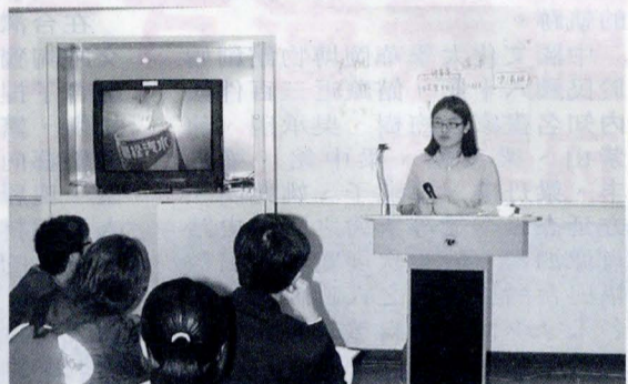
社會行銷計畫提案競賽，參賽同學展現專業的社會行銷企劃能力。

宣導和教育，使民眾養成利用垃圾專用袋來進行垃圾分類的習慣，將可回收利用與不可利用的資源分類後，利於資源的再生處理、減少環境髒亂，可維持市容整潔、提高台北市的居住品質。還有「嘿！嘿！嘿！你今天喝水了沒——推行白開水運動」、「火葬觀念推廣行銷企劃書」、「讓動物不再流浪，找回我們的街道」、「變態的青蛙王子——佐丹奴」、「NIKE 之品牌形象探討」等令人稱讚的創意構想提案內容。