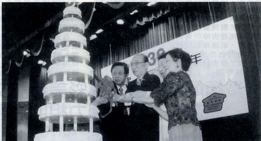
三十九週年校慶晚會，適值韓國慶熙大學創辦人趙永植八十誌慶，張董事長、林校長率全體同仁為這位遠到而來的貴賓慶生。

【記者吳曉珊報導】屹立於陽明山的中國文化大學建校迄今已邁入第三十九個年頭，3月1日的文大校慶一大早就在大恩館華風堂內舉行了慶祝大會，會中大韓民國 GCS 木蓮分會長吳貞明女士獲頒了名譽文學博士學位，九十年度的傑出校友也接受表揚，遠道而來的韓國慶熙大學創辦人趙永植博士，以及中國商銀常務監察人趙自齊先生更親臨致詞，讓文大三十九週年的校慶增添了許多光彩。為迎接三十九週年的校慶，文大舉辦各式動態、靜態的活動展覽，看著文大學生積極投入體育競賽的態度，揮灑熱情澎湃的活力，充分發揮出團結合作的精神，以及文大活潑開明的校風。