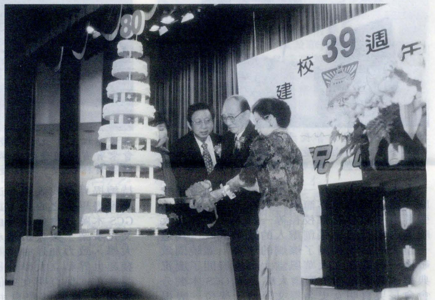
三十九週年校慶晚會，適值韓國慶熙大學創辦人趙永植八十誌慶，張董事長、林校長率全體同仁為這位遠到而來的貴賓慶生。