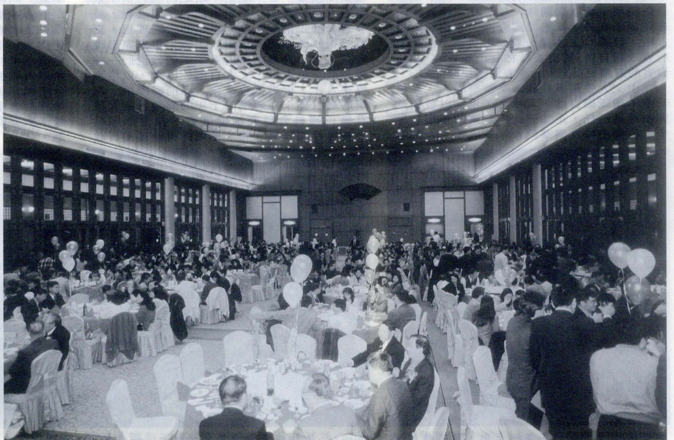
三十九週年校慶晚會，全校教職員齊聚圓山飯店十二樓宴會廳，為中國文化大學慶生。