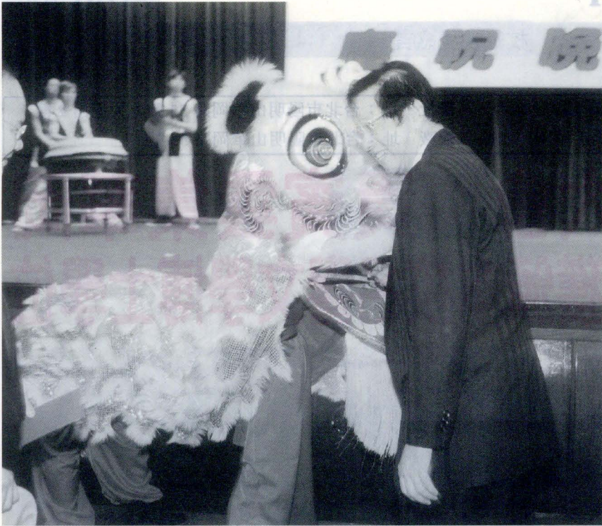
三十九週年校慶晚會，由文大國術系所獻上的舞獅表演—祥獅獻瑞，揭開序幕。

【本報訊】屹立于陽明山的中國文化大學建校迄今已邁入第三十九個年頭，三月一日的校慶一大早就在大忠館華風堂內舉行了慶祝大會，會中大韓民國 GCS 木蓮分會長吳貞明女士獲頒了名譽文學博士學位，九十年度的傑出校友也接受表揚，遠道而來的韓國慶熙大學創辦人趙永植博士，以及中國商銀常務監察人趙自齊先生更親臨致詞，讓文大三十九週年的校慶增添了许多光彩。為迎接三十九週年的校慶，文大舉辦各式動態、靜態的活動展覽，看著文大學生積極投入體育競賽的態度，揮灑熱情澎湃的活力，充分發揮出團結合作的精神，以及文大活潑開明的校風。