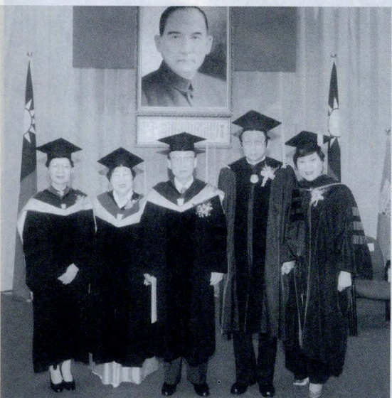
本校建校三十九週年慶祝大會，韓國慶熙大學創辦人趙永植賢伉儷共臨祝賀。

獲頒中國文化大學名譽文學博士學位的吳貞明女史很親切地表示，這次來到台灣，從一下飛機到參訪文大這一路上所受道德禮遇對待，實在令她誠惶誠恐；吳女史謙卑的態度，在正冠與頒贈證書儀式中贏得了熱烈的掌聲。同時，吳女史之夫婿－韓國慶熙大學創辦人兼學園長、世界大學校長會永久名譽會長趙永植博士表示，從 1957 年第一次訪華便與文大張創辦人建立起深厚的友誼，至今已逾三十餘年，如今見到文大一直秉承著張創辦人無畏之辦學精神來建設文大，心中十分感佩；更肯定文大長年為國家作育英才，培養社會中間份子之不遺餘力，他更鼓勵兩校未來要朝向為人類和平奮鬥的目標共同邁進。