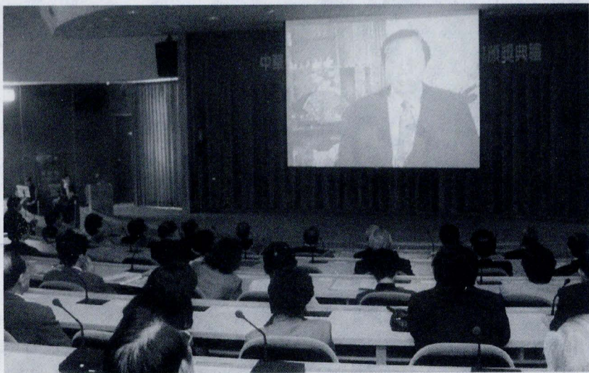
張董事長透過VCR對典禮中百餘位各界與會人士，發表當選第一屆私校十大傑出教育事業家感言。（VCR由本校媒體藝術中心製作。）

我一生的志趣在從事教育：「人生就是教育，教育就是人生。」對於大學教育的發展，我有三個基本理念，第一個理念是學術自由（和宗教自由、階級平等、族群融合、兩性平等）是民主社會的基礎。美國私立大學能有卓越的貢獻，主要是因為美國政府尊重學術自由。第二個理念是私立學校的董事會、行政單位和教授必須在權責合一和避免利益衝突的原則下，分享權力和責任（shared responsibility），營造一個和諧的團隊。現有的大學法未能掌握此一原則。第三個理念是人類已進入知識經濟、科技創新和文化內涵更為豐富的時代，大學教育必須加速國際化和多元化的步伐。未來的大學需要設立更多的專業學系，更多的跨學科的學程、也需要科技和管理結合、通識和專業兼顧。我希望這些理念是臺灣教育界共同奮鬥的目標。