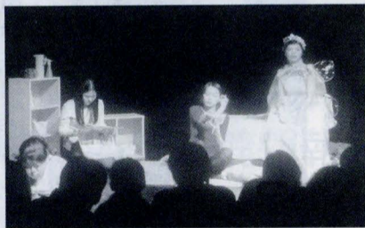
大仁館的小劇場裡，戲劇系舉行了一場別開生面的戲劇演出，讓人感受到了新式戲劇的震撼。

戲劇系學會表示，透過此次戲劇發表，讓同學們運用創新、突破的態度去詮釋，不僅各方反應良好，對同學們辛苦的創作更是一大鼓勵。戲劇系學會盼望藉由此次的機會能帶給大家一些不同的戲劇視野，並邀請每一個人都能徜徉在戲劇浩瀚無涯的領域裡！