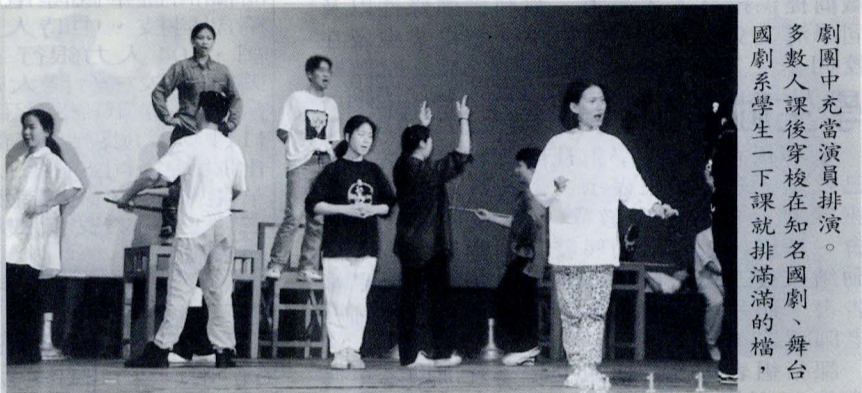
劇團中充當演員排演。多數人課後穿梭在知名國劇、舞台劇團中充當演員排演。

國劇就是傳統戲劇，是中國五千年歷史文化所發展的國粹之一，更在近代結合進步的舞台設備與音效、聲光技術，使這項逐漸失傳的民族表演鍍上一層閃耀現代感的金箔。許多人對傳統戲劇的誤解停留在生、旦、淨、末、丑等腳色的臉譜印象，因此錯失了感受戲劇之美的淋漓體認，藉由文大國劇系學生在接觸戲劇後的心得與發展，是否也帶給你對傳統戲劇觀感新的觸發？