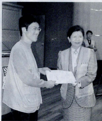
華岡園丁結業典禮，校長林彩梅親臨獎勵。

【記者徐婉怡報導】中國文化大學九十年華岡園丁績優及全勤獎頒獎暨結訓典禮，於二月二十一日假興中堂舉行。文大總務處為獎勵同學們在寒假期間之辛勞服務，除服勤期間每週三在大恩館國際會議廳放映影片供同學欣賞之外，並於寒假結束時假興中堂舉辦頒獎典禮頒發績優、全勤獎。計有績優小隊長十五名、績優同學六十五名，總計七十二名成員獲獎，凡獲獎同學皆由校長林彩梅親致精美禮物與獎狀以茲鼓勵。