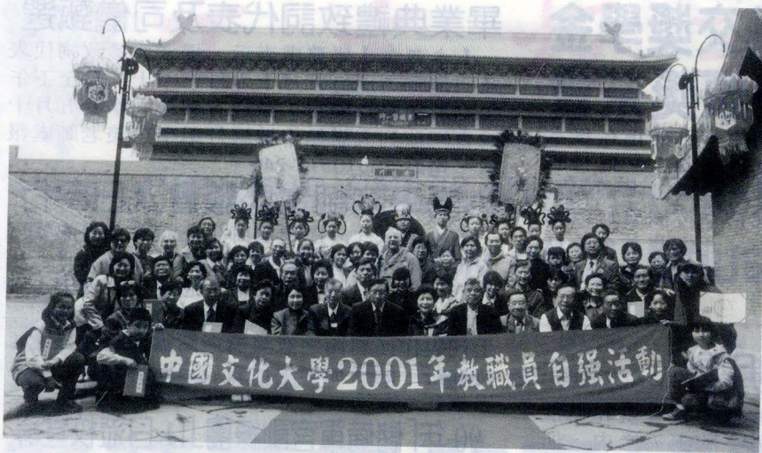
參與2001年教職員自強活動同仁一行人在西安省安遠門前合影留念。