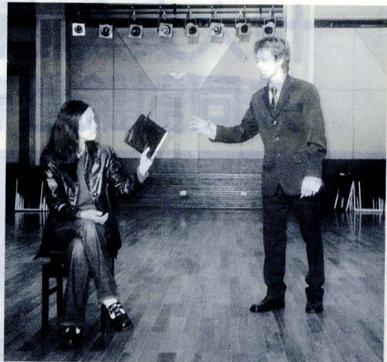
戲劇系公演《備忘錄》排演情況。

此次公演日期訂於5月18-20日，假國家戲劇院實驗劇場演出，現已開始售票，歡迎戲劇愛好者前往欣賞指教。