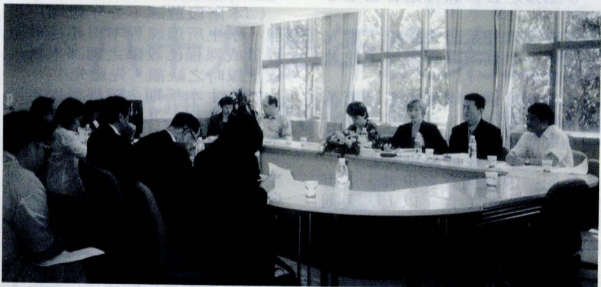
校際俄語教學學術研討會乃國內唯一定期舉辦，關於俄語文學教學及俄羅斯文化的校際研討會。

【本報訊】俄國語文學系於四月二十七日，假外語學院院會議室舉辦「第四屆校際俄語教學學術研討會」，此乃國內唯一定期舉辦，關於俄語文學教學及俄羅斯文化的校際研討會。本次研討會並獲得教育部的經費補助。多年來本校俄文系在提升全國俄語教學方法及加強與各校學術交流方面所做的努力，已受到學界重視。