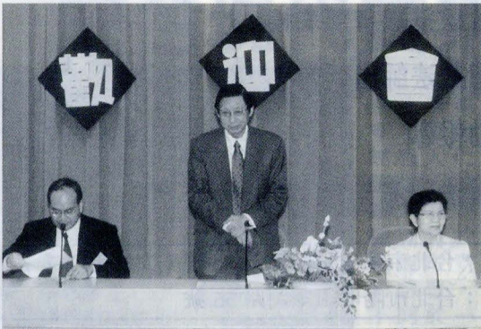
張董事長於八十九學年度僑生輔導人員工作研討會上，受邀演講「華僑的過去與現況」。