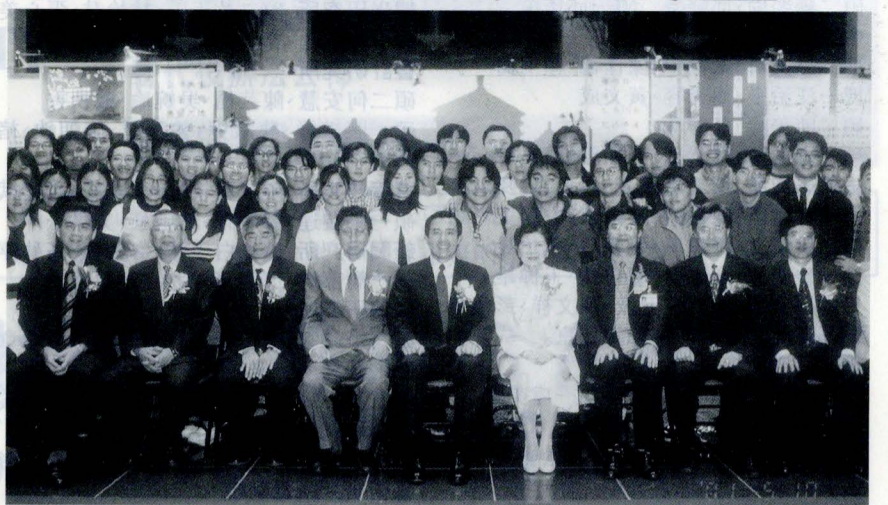
台北市長馬英九親臨參觀本校環設學院 2001 年建築暨都市設計展開幕式，會後與本校張董事長、林校長等師長，以及學生合影留念。

馬市長也在文大張董事長的引介下，參觀了這次設計展中結合「數位地球」觀念的設計展示，了解到文大擁有「數位地球研究中心」的各種衛星影像運用，尤其在建築或都市計畫上，該校環境設計學院在這項科技基礎上成立了「智慧建築模擬實驗室」、「多媒體與都市地理資訊實驗室」、「環境模擬實驗室」、「環境智識數位建築實驗室」等，讓文大擁有堅實的建築及都