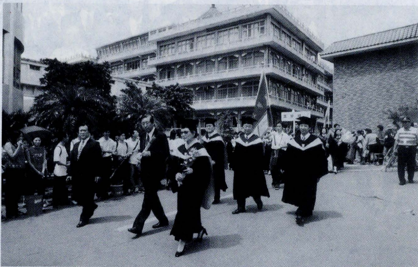
張董事長、林校長率全體師長、畢業生、在校生等，進行畢業典禮前的遊園。