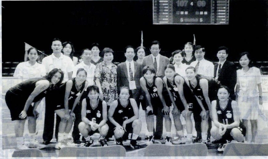
張董事長、穆董事、林校長等人前往世大運會場為中華女籃隊加油。