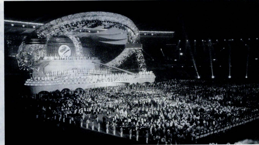
來自世界各國選手齊聚世大運會場。