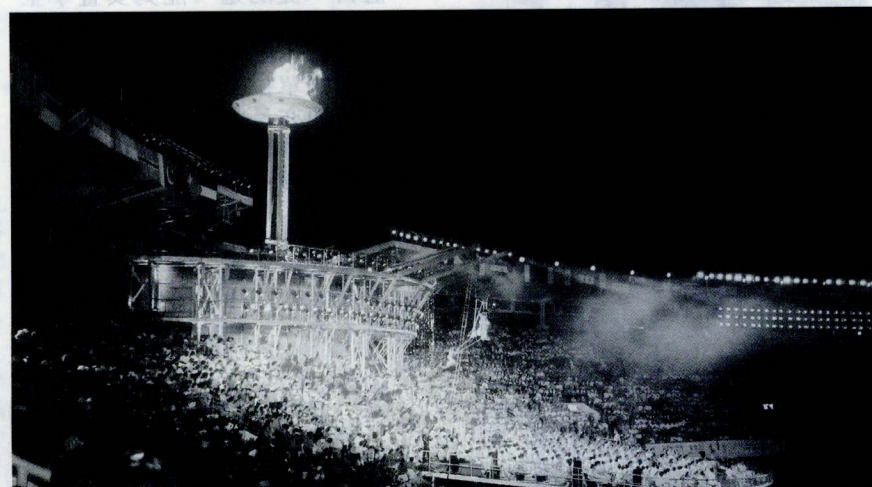
世大運開幕觀眾沸騰。

每次國內舉辦大型運動賽會，如中運、大運及全運會，承辦的各縣市都斥資大筆公帑，為運動會興建許多比賽場館，賽後利用率太低，有些地方的場館甚至因乏人管理，形同廢墟，令人詬病。反觀北京當局在興建世大運各場館之初，便已規劃好日後用途，先拿大會斥資十二億元人民幣興建的選手村來說吧，世大運結束之後，將由一房兩床變成一房四床。此外，為節省不必要開銷，當初採購選手村設備時，大會便以可拆卸的組合式家具為主，想把兩床變四床無須更換床舖，只需往上再架一張床就成了上下舖，宿舍內並預留四個網路連接線，