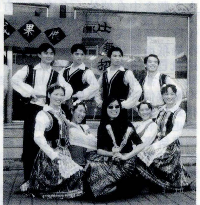
文大土風舞社在這次舞展中所著服裝，都是社員考據該地的民俗傳統服裝自製而成。

風舞界中素有「北文化南高醫」之稱，北台灣的大專院校土風舞社指導老師，也多半是從華岡土風舞社而出，可說是土風舞界無人不知無人不曉，足見文化土風舞社在土風舞界的舉足輕重。暑假於宜蘭所舉辦的國際童玩節，吸引了上萬的民眾前去觀賞，也因為國際童玩節，民俗舞蹈在舞蹈界中已漸漸抬頭，不知不覺，民俗舞蹈已佔了重要的一席之地，而華岡土風舞社此次的舞展也希望能喚醒更多喜歡民俗舞蹈的民眾繼續支持民俗舞蹈，不要為了世俗的眼光而放棄。