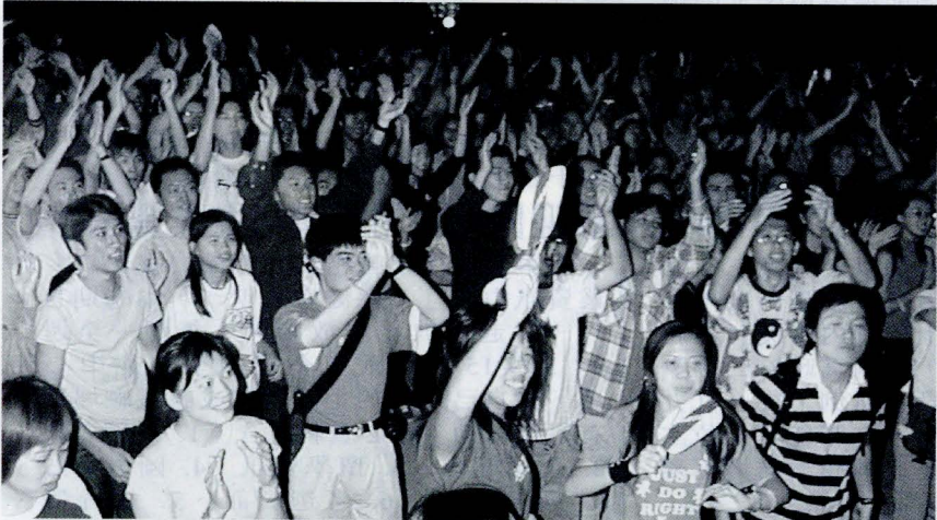
逾2000人在「歷9迷新」迎新舞會中勁舞狂飆。

在舞會裏有吃又有拿，還完全免費，不僅使與會同學賓至如歸，完善的會場維持組織則是舞會成功的重要功臣，看著跳舞的同學如此盡興，工作人員雖有無法完全享受之憾，卻為辦成迎新的目的而驕傲。這次會場氣氛還有些不同，原來是禁止抽煙，食物也必須在場外食用，難怪有一般舞池所沒有的清新，從每位新生做起拒吸煙、抗毒品的誘惑，證明也可以high地非常瘋，看哪，誰說大學生行為不檢，大家可是帶頭示範何謂「只要搖頭不要丸」。