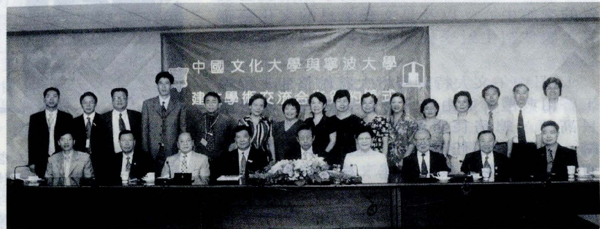
文大張董事長、林校長等師長與前來文大締約的寧波大學嚴校長等貴賓合影留念。

礙於國內之前政令對大陸文教團體來台的諸多限制，使民眾對大陸情勢發展有許多不解，近來陸委會不斷獎勵鼓勵兩岸民間團體的文化交流，教育部也宣佈將承認94所大陸重點大學，在在顯示出兩岸的交流、接觸已比往年頻繁熱絡。文大與大陸大學締結「姊妹校」之舉，在現今敏感、搖擺不定的兩岸政策中，突破窒礙難行的盲點，多少為日後兩岸的教育界開啓了一條交流示範的道路。