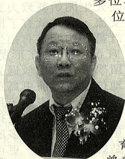
教育部長曾志朗蒞會發表演說

由於私立學校不像公立學校般，每年都享有政府的巨額經費補助，因此在我國加入世界貿易組織（WTO）之後，民間興學究竟還有多少空間？這個問題已經成為教育界的共同疑惑。目前這項提議已經獲得三個國家的多位私立大學校長回應，其中多位曾經擔任教育部長等要職。