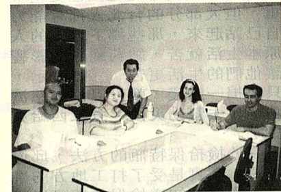
老外學華語採互動式活潑教學。

無論你是初步社會的新鮮人，亦是欲轉換跑道的二度就業者，祇要你對華語教學有興趣者，不妨可考慮報名文大華語中心所主辦的「華語師資培訓班」，詳情請洽中國文化大學華語中心，洽詢電話(02)2700-5858 分機 140、618 或 455。