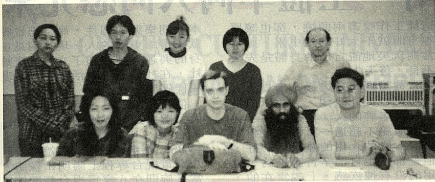
外國人學華語人數持續攀升，文大推廣部提供了普及化的學習管道。

【記者吳曉珊報導】失業率居高不下，有愈來愈多大學(專)生面臨「畢業即失業」的窘境，中國文化大學則提供所有大學(專)生一條進修與就業兼具的新出路——「華語師資培訓班」，無論將來你是要移民國外，或是欲認識