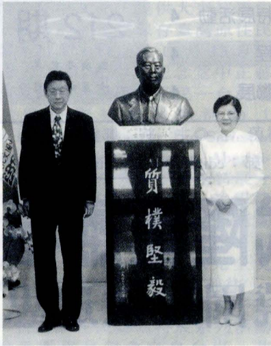
大陸雕塑巨擘曹崇恩為文大創辦人張其昀銅像塑新像，董事長張鏡湖、校長林彩梅親自主持新像揭幕儀式。

【記者吳曉珊報導】中國大陸名聞國際的雕塑巨擘曹崇恩為中國文化大學創辦人張其昀銅像親自操刀。曹崇恩不僅享譽台灣、香港、大陸等地，同時也是嶺南知名藝術家之一，眾所週知國父紀念館的「國父銅像」、澳門回