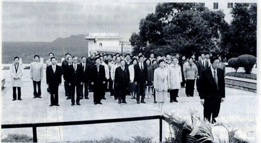
文大創辦人張其昀誕辰紀念日，文大董事長張鏡湖、校長林彩梅率全校師長在曉園致敬。

張創辦人一生，以地理方面著作為多，不勝枚舉，是一位極負盛名的地理學者；他生活嚴謹，勤於讀書，在世時常以校為家，其對於文大的貢獻，更是多不勝數，亦為一位著名的教育思想家。