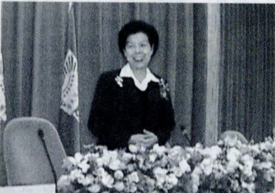
內政部長張博雅蒞臨文大暢談「新世紀新內政」。