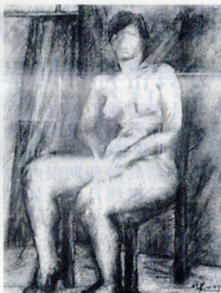
美術系學生推出「生生不息—寫出生命的氛圍」、「成長與蛻變」聯合創作展。

品，以不同的媒材，不同的繪畫方式，呈現出對藝術創作的情感與理想，這次展出不但是六位學生在學習過程中一個新的里程碑，更藉由此難得美好的展覽經驗，達到相互切磋學習、增進藝術創作之風氣。相關問題請洽華岡博物館新聞聯絡人吳嘉齡小姐02-28610511轉412。