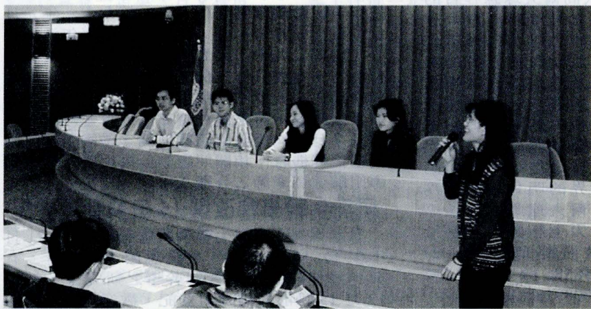
第 37 屆華岡青年選拔正式開跑，85 位參選人戰戰兢兢面對這次選拔。

在世界名校遊學，結合書香、藝術、才子、佳人編織出人生彩夢。文大 2002 年寒假推出日語遊學團、澳洲綠野遊學傳奇、英國西歐劍橋團、加拿大住宿家庭團、美西柏克萊大學團多種選擇。儘早報名有特別優惠，每週二、五中午十二點於文大大典館 214 及 216 教室；或每週三、六，下午兩點鐘於建國南路推廣教育中心皆有遊學實況說明會，敬請電話預約。專業諮詢服務電話：(02)2700-5858 分機 361-369，免費專線：0800-212-862 文大遊學組。