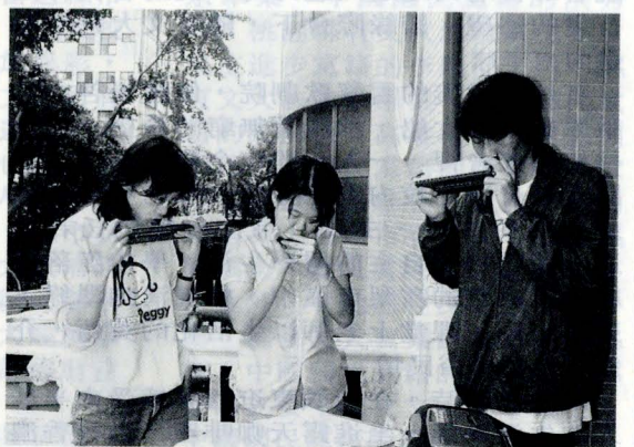
口琴社員合奏大小口琴，譜出美妙樂音。

獲選校內優良社團之一。她指出，一般人認爲口琴只是街頭表演樂器，不登大雅之堂，其實這是非常錯誤的觀念，在許多大型正式音樂比賽中，就設有口琴項目比賽，證明了口琴在音樂表演中的重要性；而且口琴的音律寬廣，不僅在個人獨奏時，能充分表現演奏者的技巧外，合奏時的演出，更能發揮音樂重奏的豐富性，將上口琴攜帶方便，其實更適合在戶外表演。有興趣的同學們可以上網 http://www.pccu.edu.tw/club/hkhc 查詢資料，或上 bbs: 140.137.38.151，站名爲 Pccu Sound 洽詢。