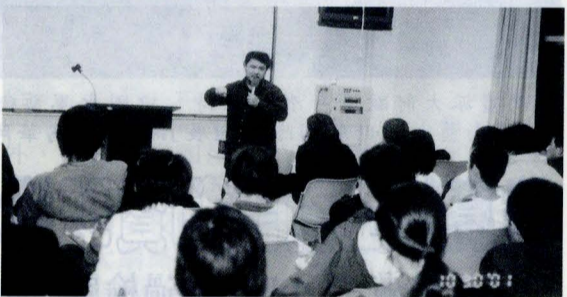
林正盛與文大同學談電影時表示，看電影應避免罹患「文化偏狹症」。

用這樣深層反省的態度出發，台灣導演近年的作品屢獲國際影展評審的青睞。然諷刺的是，真正回到台灣本土，這類片子卻被片商視成「票房毒藥」，全然無法和好萊塢的聲光刺激相抗衡。林正盛笑稱台灣患了「文化偏狹症」，他認為好萊塢電影不是不好，而是當台灣人被餵養習慣了，只能欣賞這類聲光刺激的電影，不能看別的，那就錯失了多元文化的精采處了。