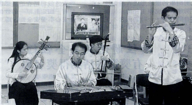
「龍蝦週」現場邀請全國唯一具備堅強陣容的專業科班背景的視障音樂團體「妙音樂集國樂團」到場演奏。

11日中午文大特別為「龍蝦週」舉行開幕茶會，現場並邀請全國唯一具備堅強陣容的專業科班背景的視障音樂團體－「妙音樂集國樂團」到場演奏。由於文大國樂系是全國第一個保障視障生入學的科系，因此，成軍迄今一年多的「妙音樂集國樂團」的多數成員，都是畢業自文大國樂系的校友。音樂是聲音的藝術，他們雖然看不見彼此，更毋須指揮，但整齊劃一的弓法與十足的默契演奏，引起在場聆聽的文大同學熱烈的掌聲。