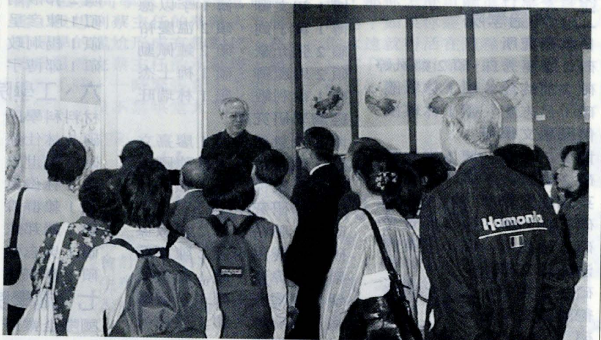
將近六成的新生，在經過校園導覽後，表示對文大的負面印象改觀。圖為文大新生參觀華岡博物館情況。

文大將曉峰紀念館列為新生的重點導覽項目，一棟含括校史室、圖書館、資訊中心、華岡博物館，榮獲 1999 年世界傑出建築獎的新穎建築。原先聽聞外界關於文大的負面風評，使對文大產生刻板印象的新生們，在經過校園導覽後，有六成顯示對文大的印象有改觀。