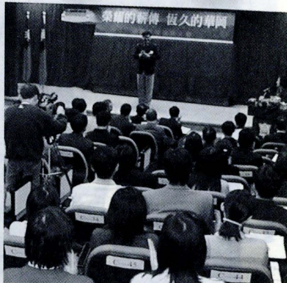
85 位候選人參與卅七屆華岡青年決選，競爭相當激烈，所有候選人無不戮力以赴。

19 日上午，華岡青年候選人便以端莊，正式的穿著在大恩館的國際會議廳嚴陣以待。面臨準備許久的口試決選終於到來，每個候選人都懷著謹慎的心情做上台前的最後演練。儘管如此，選拔進行的過程候選人也都表現出風度，給予彼此熱烈的掌聲。雖然每個候選人都相當的緊張，但卻也都能以平常心來面對整個過程及結果。校長林彩梅開場時表示，期望每位候選人能夠全力以赴，現在能夠坐在會場上的候選人都已經相當優秀了，當選與否只是個名義，也希望大家不要太在意這次活動的結果。