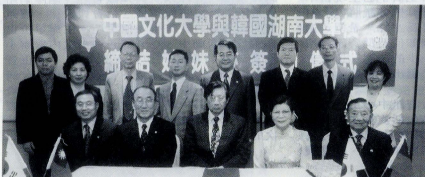
文大與韓國湖南大學締約後，文大張董事長、林校長等師長與湖南大學校長尹亨燮合影留念。