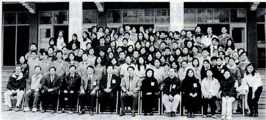
文大帶動中小學社團發展，10所中小學校長等代表赴文大致謝，與11個社團同學合影留念。

【記者賴秀玲報導】為落實教育部「大專院校社團帶動中小學社團發展計畫」，文大特與北市鄰近十所中、小學合作推行社團活動，包括平等國小、三玉國小、啓聰學校、華興中學、格致國中、湖田國小、福林國小、陽明山國小、天母國小、立農國小等10所中小學。這次活動之前順利完成教學互動，於12月26日在文大曉峰紀念館國際會議廳舉辦「活動成果頒獎典禮暨中小學結盟工作觀摩會」。這次由文大輔導的中小學社團，總計受益