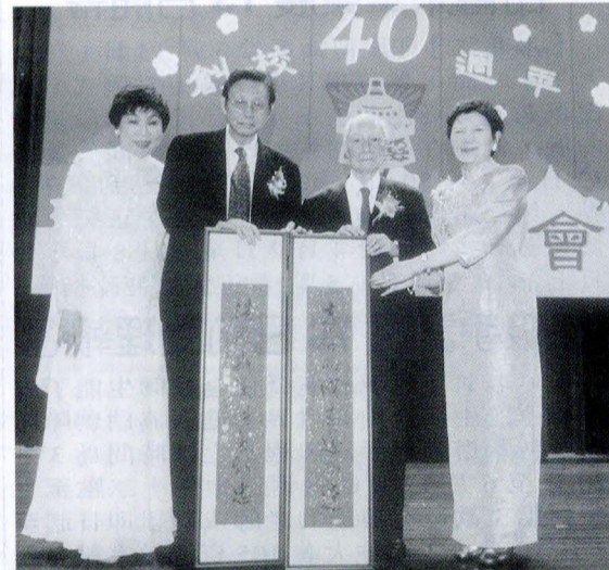
張董事長、穆董事、林校長代表文大同仁，獻上對聯賀何董事期頤大壽。

下，從無到有、從華路藍縷中開創康莊大道，在這四十年間替國家培育了無數人才，領導了各行各業的潮流。今年首創的薪火相傳與校旗繞校，是由文大體育室主辦。除此之外，體育室還主辦了熱力四溢的啦啦隊比賽，使歡慶40週年的文大不僅有體育選手薪火相傳的「力」，還有啦啦隊的「美」。