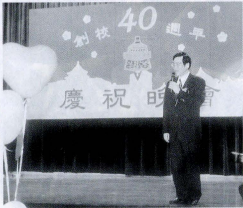
教育部長黃榮村蒞臨校慶晚會致詞。