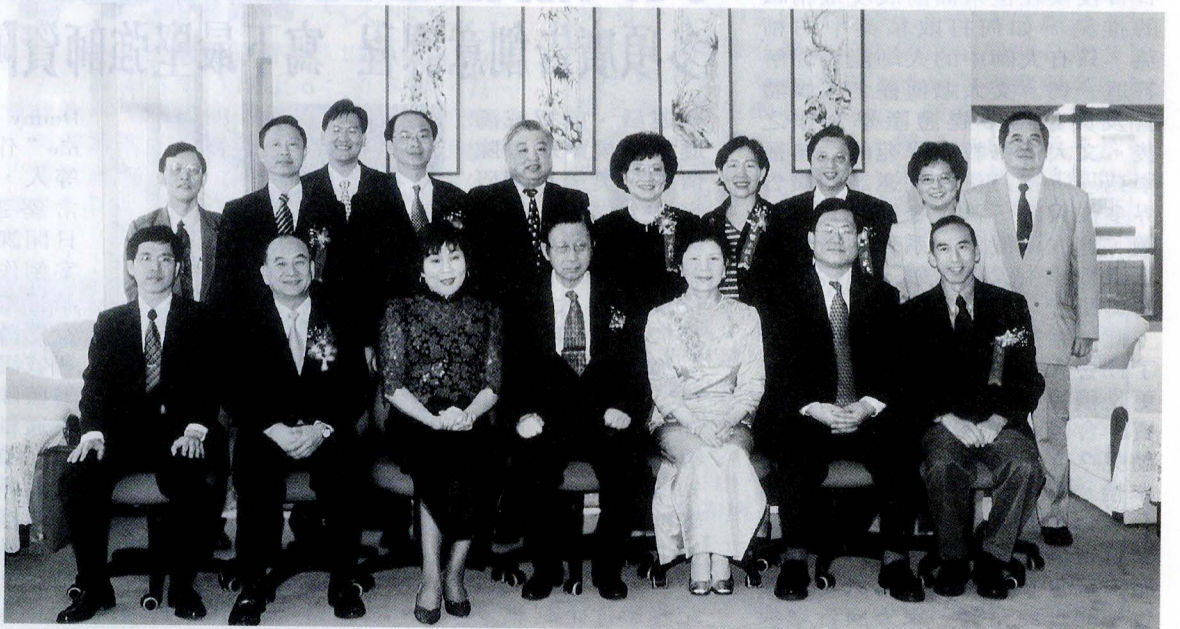
傑出校友當選人與母校張董事長、穆董事、林校長等師長合影留念。

《文大校訊》是一份報導教育政策、記載華岡大事，與加強全校師生溝通的刊物，歡迎全校師生提供訊息進行交流。