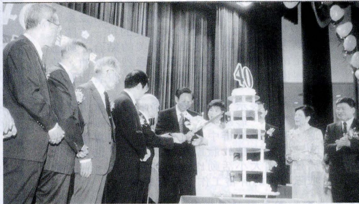
張董事長、何董事、穆董事三人共切文大四十歲生日蛋糕。