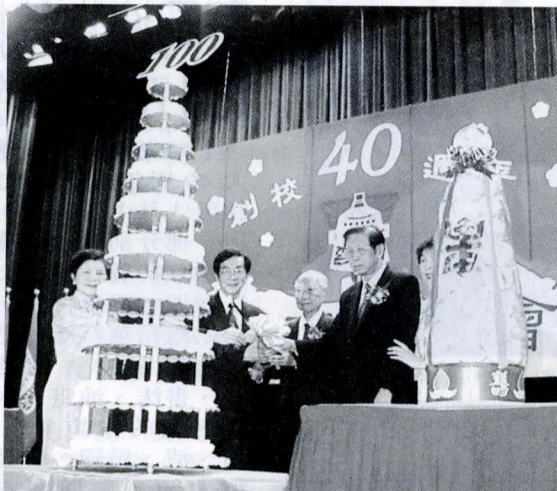
教育部長黃榮村(左二)蒞臨文大晚會，與張董事長、何志浩董事、穆閩珠董事、林校長共切生日蛋糕。(新聞詳見第四版)