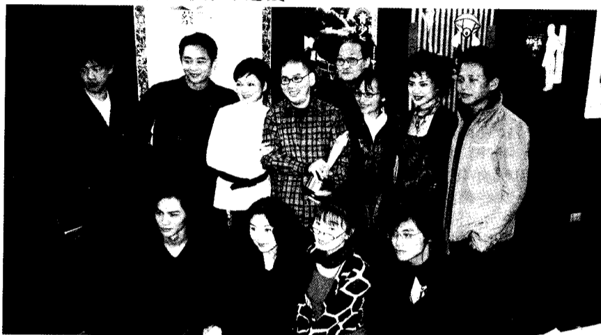
文大校友蔡明亮導演（後排左四）及《你那邊幾點》演員陣容，與觀眾進行了一場電影對話。