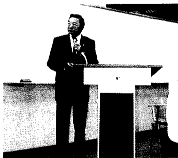
立法院副院長江丙坤指出，應刺激消費市場買氣，景氣才能復甦。

江丙坤指出，台灣早期之所以能夠創造出經濟奇蹟，是因為有安定的政經環境做為後盾，如土地改革的成功，營造出良好的投資環境，都使得人民對政府有充足的信心，願意將大筆的資金投入，甚至在面臨亞洲金融風暴時，也能面不改色，絲毫不受影響，經濟成長率穩坐亞洲第一。所以他認為，現今政府也應營造出一個安定的環境，並促進民間投資，增加公共投資計畫，以解決當前經濟的困境。