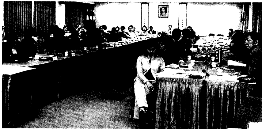
所有大一導師聚在一起，研習最新輔導方法。