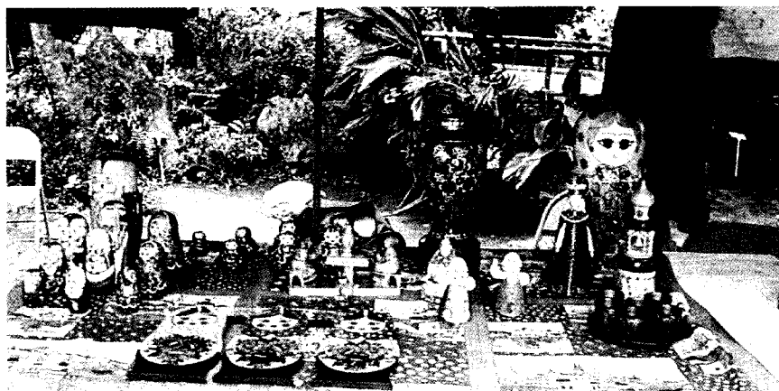
外語週展俄文系展出可愛的俄羅斯娃娃。

此外，文大海外遊學誠徵短期工作夥伴，工作內容主要利用課餘時間在校園中推廣遊學業務，或至各大專院校張貼海報及 DM。凡是熱情活潑，工作認真，備有機車的同学都可應徵，時薪 80 元。工作地點在文大等各大專院校內，工作時間為五、六月期間的每週一至週六時間，採排班制，一星期至少二天。意者請備身份證、學生證正反影本及課表逕洽文大海外遊學組，電話 2700-5858 分機 584 陳小姐、581 蔡小姐。251925。