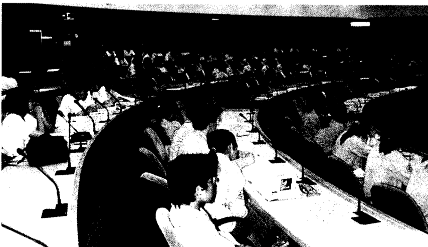
學生會為學生議事殿堂，文大學務處鼓勵學生積極成立。

由於並非所有人都願意加入學生會，而學生會卻又具有決定全校學生事務的權力，因此文大學生事務處課指組相信，一開始的程序訂定的越清楚，之後的運作會越容易；一開始所涉及的層級越廣，之後的公信力就越高。學生會並非屬於少數活躍者的，因此學校有義務替學生監督學生會的必要，當學生會侵害學生的權力，如帳目上的問題或其他，學校應該責無旁貸進行處理。相信在這樣的前提之下，文大的學生會將更趨於健全完善，能為學生做的事情也更多。