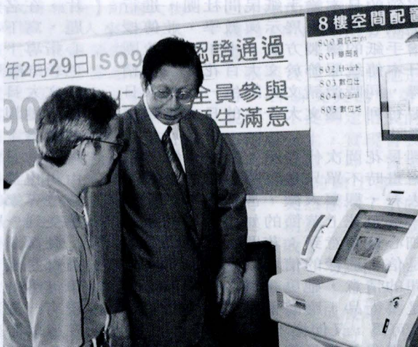
林郁方立委（左）在張董事長帶領下參觀校園，認為文大的軟硬體其實遠勝過許多國立大學。

全局爭取經費，目前許多人對文化大的衛星運用相當感興趣，在災害的防治上也相當有用，林郁方建議文大可以請國科會、教育部召開公聽會，讓文大的衛星研究可以獲更廣泛運用。