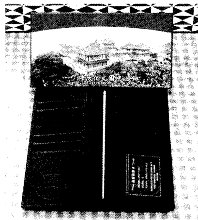
文大教師節的皮包贈禮，質精美觀，不少教職員還想添購當贈禮。

教師節禮品發放由各系所助教領取，再一一轉交至各位老師的手上，希望今年贈與教師的真皮