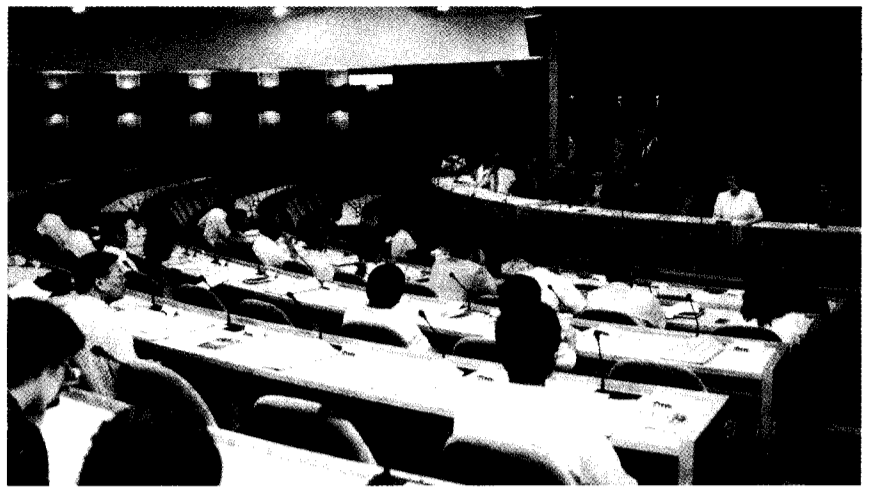
張董事長、林校長等師長歡迎 30 餘位新任專任教師投入華岡大家庭。數量過多的技術學院和大專院校，如何提昇競爭力是文大即將面臨的挑戰。穆董事表示，文大將會持續努力，維持全國學生人數數量最多的地位。