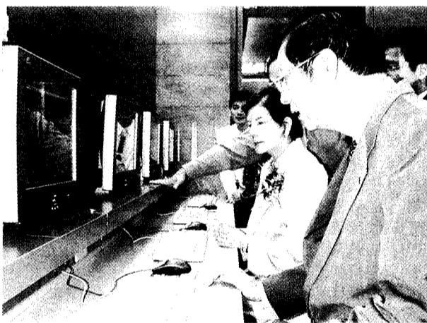
張董事長、林校長共同體驗大倫館學資中心的網咖之旅。

【記者李桂媚報導】為了迎接新學年，中國文化大學整建男生宿舍大倫館為「賓士級宿舍」，不僅有全新的室內外空間品質，同時更新了床組家俱，採密碼鎖房門，並規劃視聽交誼中心，更特別的是，宿舍內設置了類似網咖的24小時學習資源中心，配設有30部液晶螢幕電腦，連接校園網路，提供