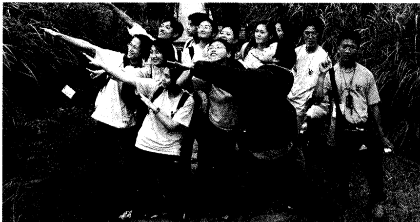
發現華岡體驗營的生活，讓參加新生至今難忘。

不可否認，「發現華岡體驗營」辦得相當成功，在最後一個「粉墨登場」單元時，許多歡笑和感情一同交織於興中堂的舞台上，鄉土劇、童話短劇、MTV等各組集思廣益的精華，展現三天兩夜各組激盪的成果。最後離情依依的時刻，絕大部分新生都表示，同宿文大大賢館的夜晚將永難忘懷，相約在文大的日子裡，大夥還要再聚首，共度燦爛的大學四年。