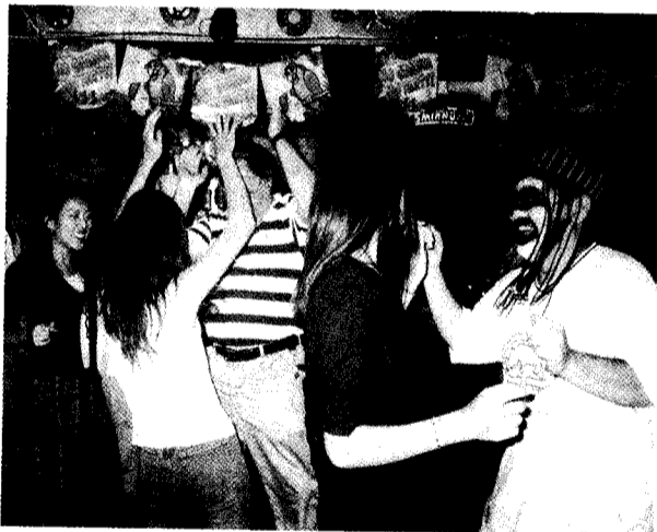
萬聖節舞會中，文大英語會話社帶頭搞鬼。

並且能夠藉著參加舞會多多認識新朋友，當然一方面也是因為配合西洋萬聖節的到來，而希望讓從來沒有參與過萬聖節活動的同學們一同去感受西洋萬聖節的趣味。