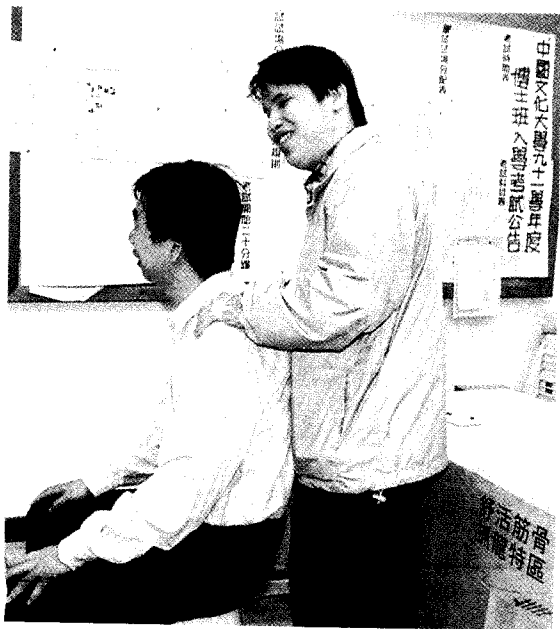
這次龍蝦週系列活動的「舒活筋骨抓抓龍」，吸引了許多文大師生前往體驗。

參賽者事先都要用眼罩將眼睛矇起來，在裁判一聲令下，每位參賽者無不卯足全力拼命包水餃，他們在黑暗中用手摸餡料，再拿餃子皮包住餡料，將皮的空隙捏緊。這些平常做起來又快又簡單的動作，這時就變的又慢又亂，一回打翻水，一回弄翻餡，現場亂成一團，笑料百出，一旁觀看的同學還不時的提示參賽者東西的位置，熱烈的為他們加油打氣，有的人甚至比參賽者更加投入緊張。