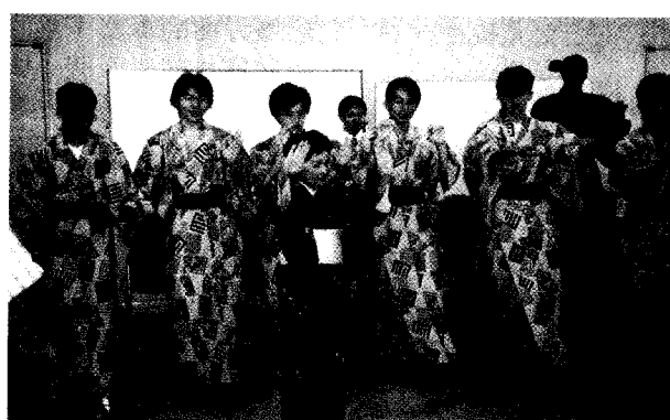
推廣部日本遊學團帶領學員體驗日本文化。

【陳吟鈴特稿】一直認為一輩子遊學一次是件浪漫的事，因為不僅是旅行，如果能居住在異國的城市中，就可以從許多不同的生活點滴，發現真實自我。選擇日本，尤其是在天災之後，可能是一份緣牽引著，才會來到這個不太遠也不太近的國家。似乎有著相同的面貌，卻擁有不同國情的地方。星期六的午后，在機場穿梭的人群中，面對人車熙攘往來，心也跟著飛了起來，從下飛機起，一直不能相信已在這夢想的國度—日本。