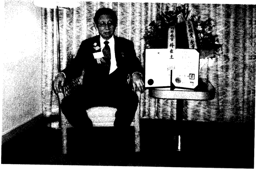
韓國統一部前部長朴在圭特贈花籃致賀張董事長獲獎。