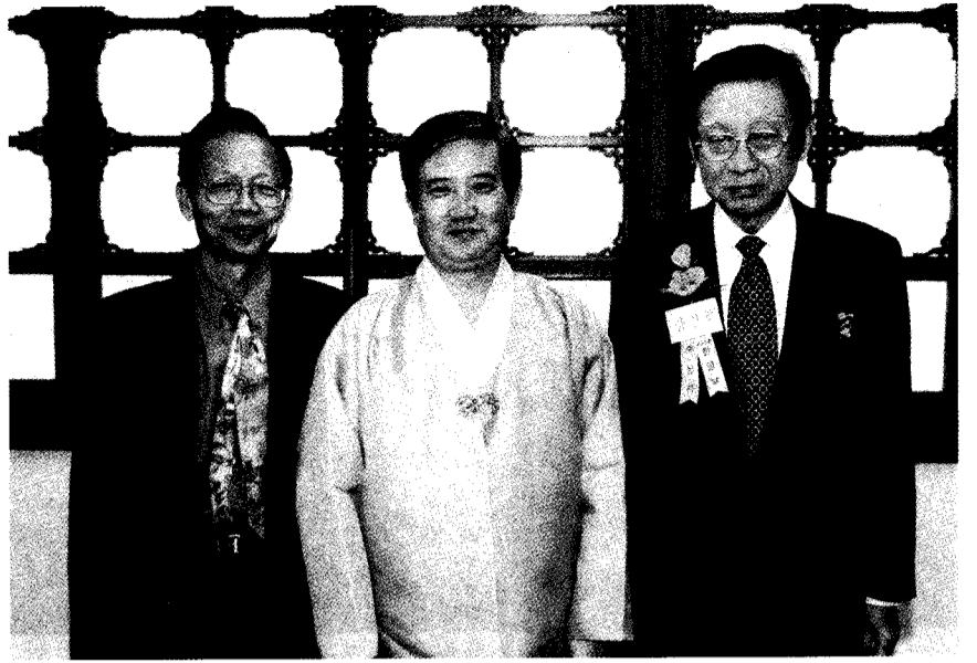
韓國文化觀光部長接見張董事長，肯定他對韓文教育的貢獻。