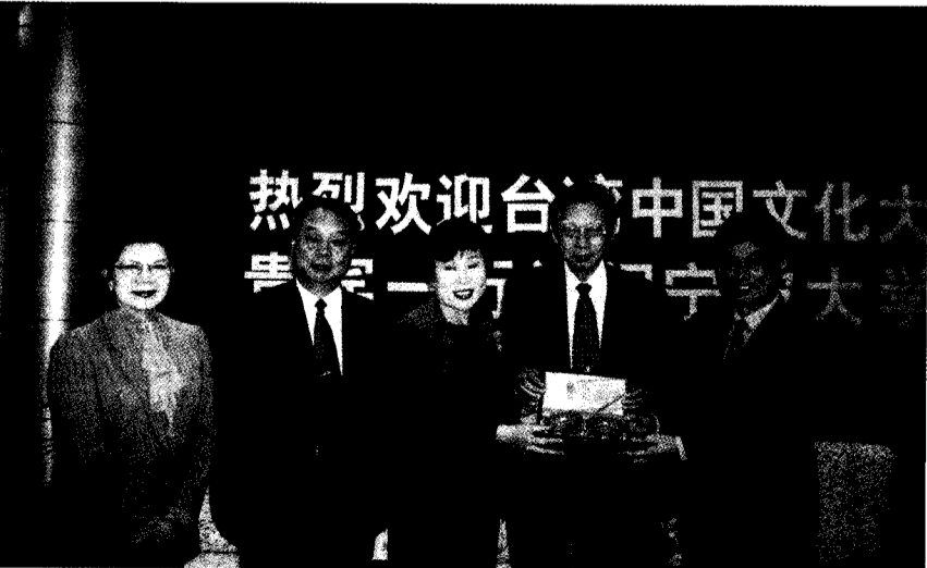
文大張董事長、穆董事、林校長等師長一行前往寧波大學獲該校校委書記(左二)、副校長(右一)等熱請款待。