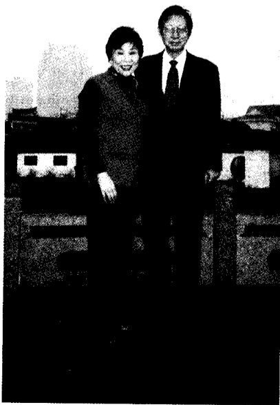
張董事長帶著夫人穆董事，同遊幼時遊憩地「月湖」。

20 日張董事長率文大師長返台，結束了這趟短暫的行程，同時也開啓了文大新階段充實的學術交流和發展。(本文作者為中國大陸研究所所長兼學務長)