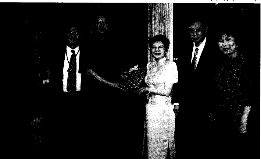
杭州市市長茅臨生(左三)特地宴請文大師長一行，簡報杭州市的未來發展。