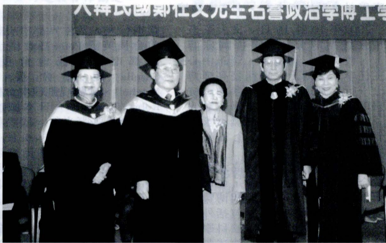
鄭在文獲得名譽博士學位後，偕其夫人（左三），與文大張董事長、穆閩珠董事、林彩梅校長合影。

使節團訪華，並就中韓兩國關係架構問題交換意見，達成雙方互設代表，在韓國全力協助我國僑民，增進強化兩國新關係以及文化交流。1999 年我國發生九二一大地震，鄭在文即時趕赴我駐韓代表處慰問並捐款賑災。文大基於鄭在文以上對中韓外交的貢獻，以及其活躍於國際舞台的傑出表現，特在我國駐韓代表處代表李宗儒等人的推薦下，經文大名譽博士學位審查會議通過，頒贈鄭在文名譽政治學博士學位，以示崇敬。