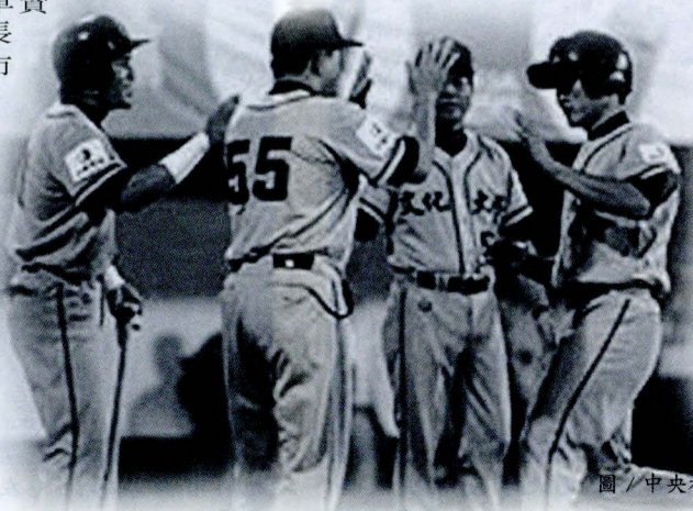
文大棒球隊過關斬將獲得今年世界大學棒球賽冠軍。

文大在冠軍賽中與天理大學第二度交手，雖然天理大學曾再預賽中以零比十的懸殊比數敗給文大，但其實力也是不可忽視。冠軍賽中，文大於三局下靠著