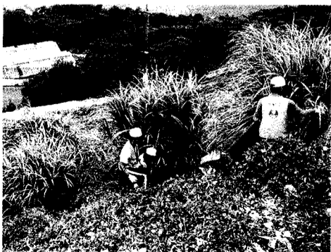
文大華岡園丁下山間險坡，只爲還陽明山清潔面貌。

事實上，爲了落實大學生服務社區的教育以及增進和社區間的互動，一直以來，文大就積極從事社區打掃的工作。不論是之前響應納莉災後的「一清專案」或是平時的打掃，都受到市府及文大附近居民的一致肯定。唐總務長也表示，爲使校園景觀與社區環境有統一美感，人行道的美化與造街活動，是文大目前與未來積極推動的目標。