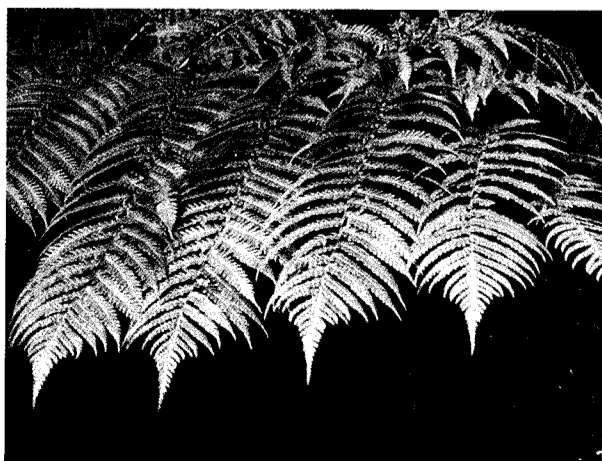
陽明山許多特有植物生機盎然。

談到陽明山山藥，根據國科會研究發現，山藥能抑制癌細胞，其效用還包括抗菌、抗氧化、增進人體免疫力，而且完全無毒性，既可以美白，又不像馬鈴薯、芋頭會令人發胖，可謂為女性同胞們的美容聖品。由於山藥的特殊效用，政府目前也大力地