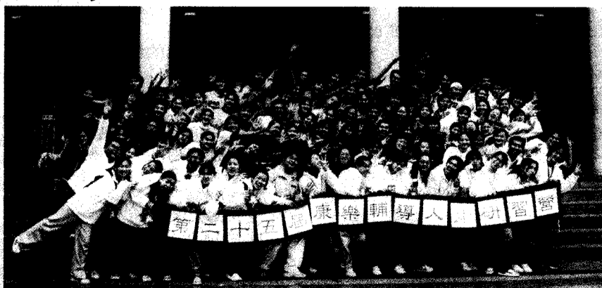
康輔研習營爲文大帶來歡欣氣息，成員未來將成爲陽明山搞笑種子。

華岡康輔社也說，華岡康輔社每學期透過甄選、迎新、授服與送舊四大活動讓康輔社順利運作，不僅如此，康輔社每個星期中也開了兩次的課程學習機會，提供學生們學習一些團康活動、戲劇、唱跳、美工、輔導與吉他等活動，而且更不定期舉辦一些社團聯合活動，像是這次的康輔人才研習營就是一個很好的例子。