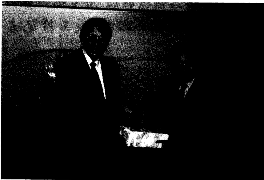
國士館大學為張董事長等一行洗塵，張董事長特致贈西原理事長紀念品，表達謝意。