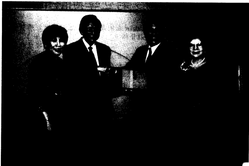
三浦校長代表國士館大學致贈張董事長、穆董事、林校長紀念品，表達歡迎之意。